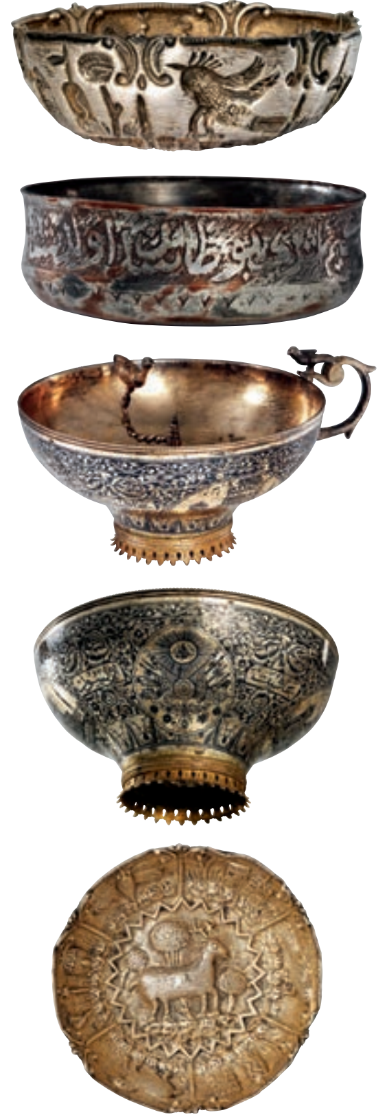
Süslemeli zemzem tasları.

Osmanlılar zamânında gerek yerli halkın gerekse hac mevsimlerinde gelenlerin zemzemden rahatlıkla faydalanmaları için çeşitli tedbirler alındı. Hicrî 933'te (1526-27) başlayan zemzem binâsını yenileme faaliyetleri hicrî 948'de (1541-42) tamamlandı. Zemzem kuyusunun üzerine bir saçak, onun üzerine de kurşunla kaplanmış bir kubbe yaptırıldı ve ahşap olan tavan süslemeleriyle zemin mermerleri yenilendi. Mîlâdî 1612'de Sultan I. Ahmed, zemzem kuyusunun girişi kısmına demir bir kafes yaptırarak daha emniyetli bir hâle getirdi ve su yüzeyinden bir metre kadar aşağıya demir bir ızgara konarak insanların zemzem kuyusuna düşmeleri ihtimâli önleildi. Kuyunun demir ağızlığı üzerine dört kişi çıkararak buradaki demir kafeslere dayanarak demir makaralarla gece gündüz hiç durmadan münâvebeli olarak demir çatal kovalarla su çekerlerdi. Sikâye görevlisinin tek başına hacıların ihtiyâcını karşılaması mümkün olmayınca bu görevliye bağlı İslâm ülkelerinin her bir vilâyeti için birer adet olmak üzere sakalar görevlendirildi. Bunların görevi, hacıların, -özellikle memleketlerine götürecekleri- zemzeminin sağlığını korumak için iki kapalı depo yapıldı ve su çekmek için de pompa monte edildi. Tâmirât-ı Âliyye müdürlüğü göreviyle Hicaz'a gönderilen Hezarfen Edhem Efendi (ö. 1904), ziyaretçilerin içine düşmelerini önlemek maksadıyla zemzem kuyusunun üstünü kafes şeklinde yekpâre kurşun dökerek kapattı. Mekke idâresi Suûdîlere geçince birkaç defa yenilenen zemzem binâsının girişi tamamen