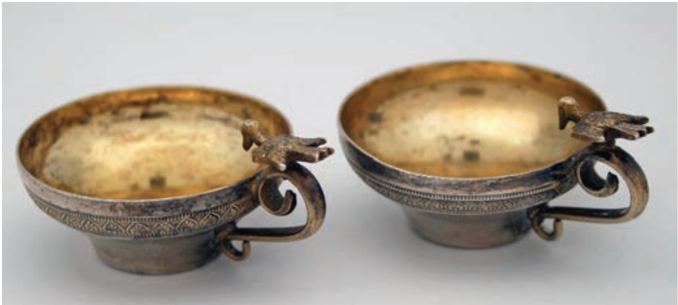
Kulpları kuş figürlü, tuğralı gümüş zemzemlik, XIX. yüzyıl.

İlk açıldığında toprak üstünde akan tek gözenekli bir kaynak iken Hz. İbrahim tarafından kuyu hâline getirilen zemzem, Mekke'de hayat emârelerinin görülmesine sebep oldu ve Yemen-Suriye güzergâhında seyahat edenlerin dikkatlerini çekti. Ana yurtları Yemen olan Cürhümlülerden bir kâfile dinlenmek için Mekke civârında çadır kurarak mola verdi. Bu esnâda zemzemle bulunduğu yerde dâire şeklinde kuşların uçtuğunu gördüklerinde, "Bu tür kuşlar ancak su kaynağının bulunduğu yerlerde bu şekilde uçarlar." diyerek aralarından iki kişiyi teftiş için gönderdiler. Böylece suyun varlığından haberdar olan Cürhümlüler, yaptıkları istişâreden sonra Mekke'ye yerleşmeye karar vererek Hacer'e başvurular. Hacer, içip faydalanmaları dışında zemzemde haklarının olmadığını