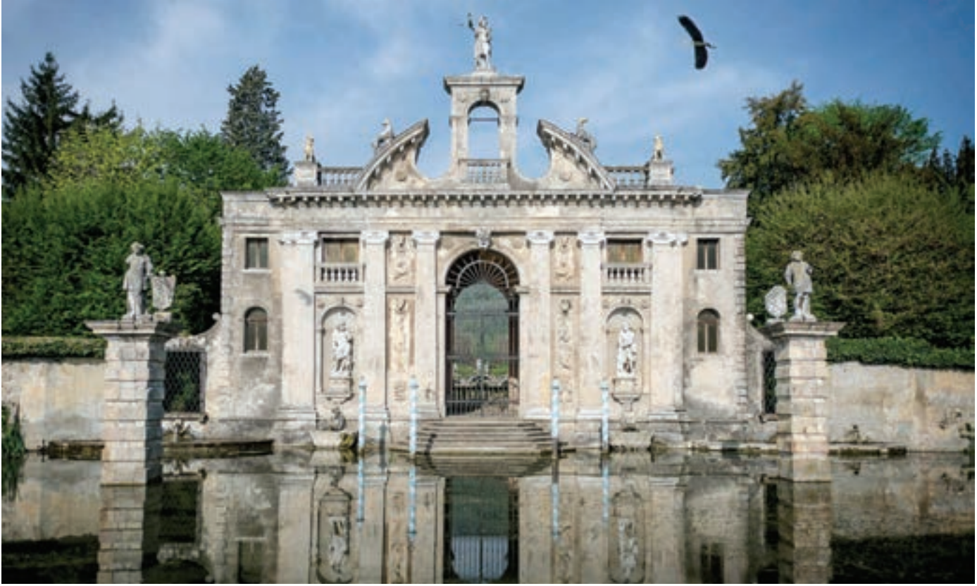
Abano Montegrotto kaplıcaları, İtalya.

duş sistemini andıran bu su akıtma düzeneği Montaigne'i etkilemiştir.