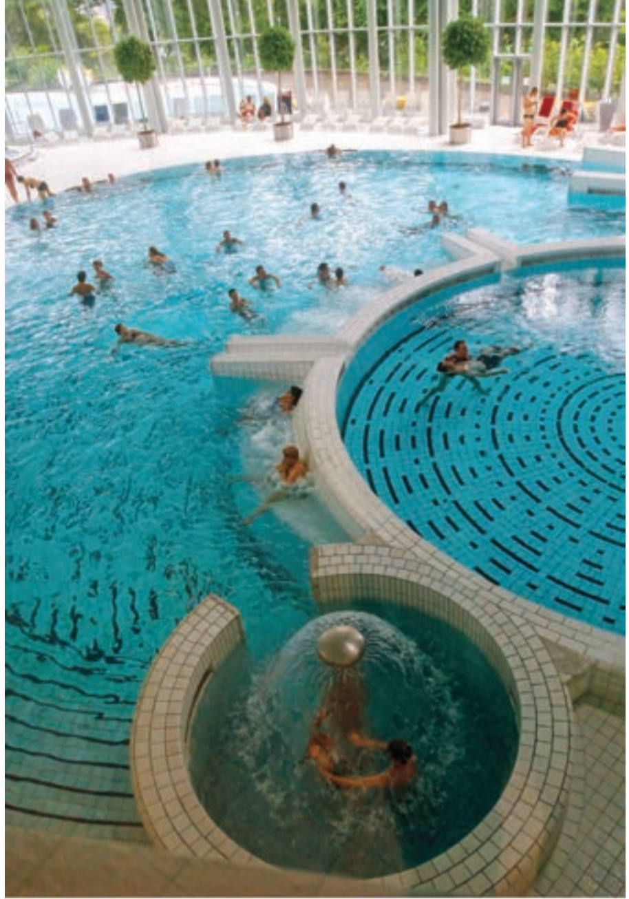
Liege kaplıcaları, Belçika.

Epernay şehrinde, felsefî ve dînî konularda ihtisaslaşmış Mösyö Maldonat ile karşılaşan ve uzun uzun sohbet eden Montaigne için bu görüşmedeki en etkileyici konu, hiç şüphesiz, kaplıca tedâvisi olmuştu. Maldonat’ın yenice döndüğü Liege’deki kaplıca sularıyla ilgili anlattıkları, diğer konulara nazaran Montaigne’in ilgisini daha fazla çekmişti. Sindirim rahatsızlığı ve böbrek taşlarından muztarip olan Montaigne’in konuya gösterdiği alâka, Maldonat’ın Liege kaplıcasını ve tedâvi amaçlı kullanımındaki incelikleri husûsundaki ayrıntılı anlatımının esas sebebi bile olabilir. Günlüğü tutan kâtibin verdiği bilgiye göre, Maldonat’ı dinleyen Montaigne, Liege kaplıcası ile kendinin âşinâ olduğu Gaskonya kaplıcasını karşılaştırmış ve bu iki kaplıcanın sularının aynı nitelikte olduğuna hükmetmiştir.