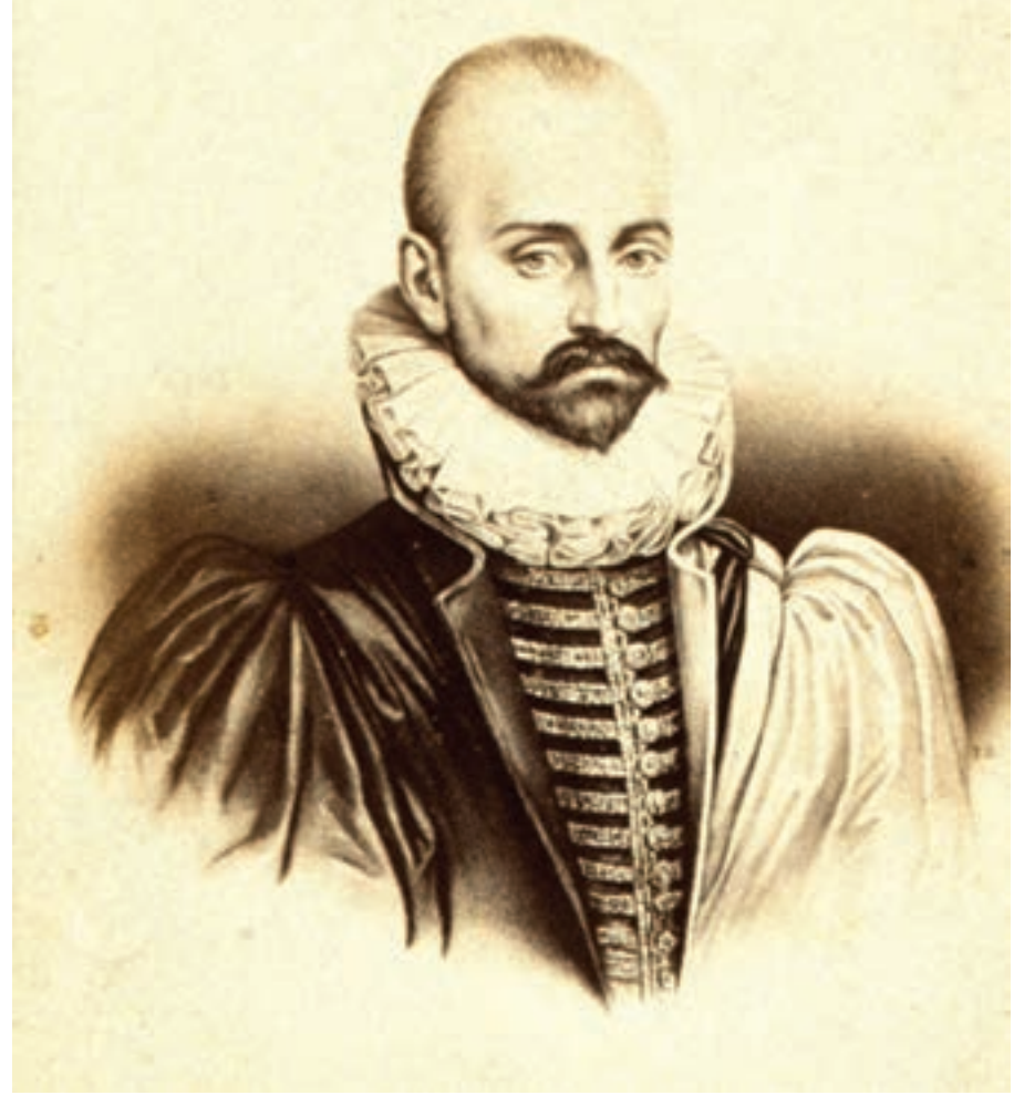
E. Desmaisons, M. E. de Montaigne. Wellcome Koleksiyonu.

Bütün zorluklarına rağmen kısa veya uzun seyahatleri göze alan bir başka grubun üyeleri ise şifâ umuduyla yollara düşen hastalardan oluşuyordu. Özellikle varlıklı, seyahat için harcayacak parası olan hastalar devâ bulmak ümidiyle günler, hatta aylar sürecektir seyahatlere çıkmaktan kaçınmıyorlardı. Geçen yüzyıla kadar zamânının tıbbî bilgilerine hâkim, tedâvi konusunda mâhir bir hekim bulmak hiç de kolay değildi. Bu yüzden, işinin ehli bir hekime veya cerrâha görünmek ve şifâ bulmak, hiç de küçümsenmeyecek mesâfeleri kat etmeyi gerektiriyordu. Mâmâfih bütün dünyâda şifânın tek kaynağı hekimler de değildi. Avrupa'da ağır hastalıklara yakalananlar, günahlardan arınmak ve şifâ bulmak için