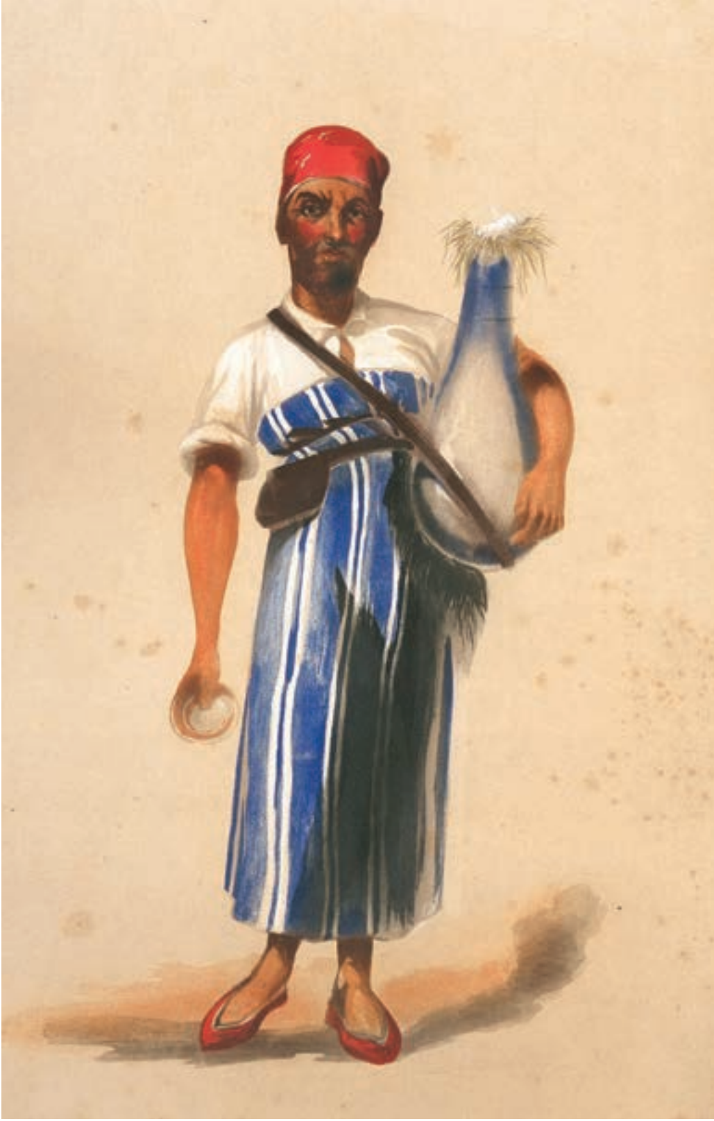
Forbes Mac Bean, Sakalar, İstanbul ve Ege Adalarında Karakter ve Kostüm, 1854.