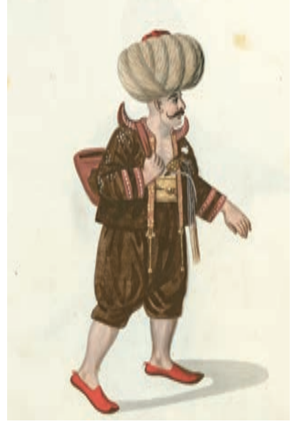
Saka, XIX yüzyıl.