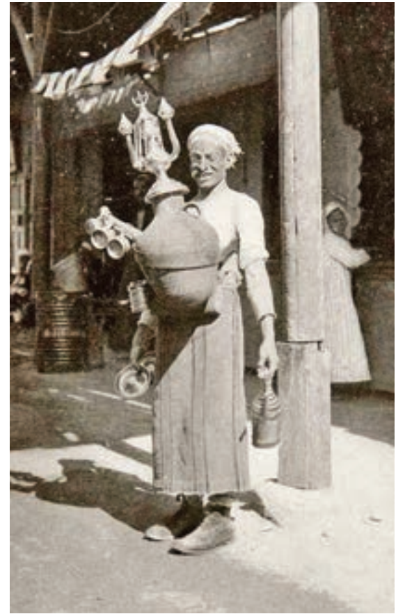
Mısır'da bir saka, 1922.

Saka Baba adını taşıyan mezarlara, türbelere, sokak isimlerine İstanbul'un bilhassa târihî semtlerinde rastlamak mümkündür. Bu durum, İstanbul içerisinde birden fazla Saka Baba'nın mevcûdiyetini akla getirmektedir. Bu mezarların birisi istisnâ olmak üzere hemen hepsinin sur dışında yer almaları dikkat çekicidir. Bu durum onların