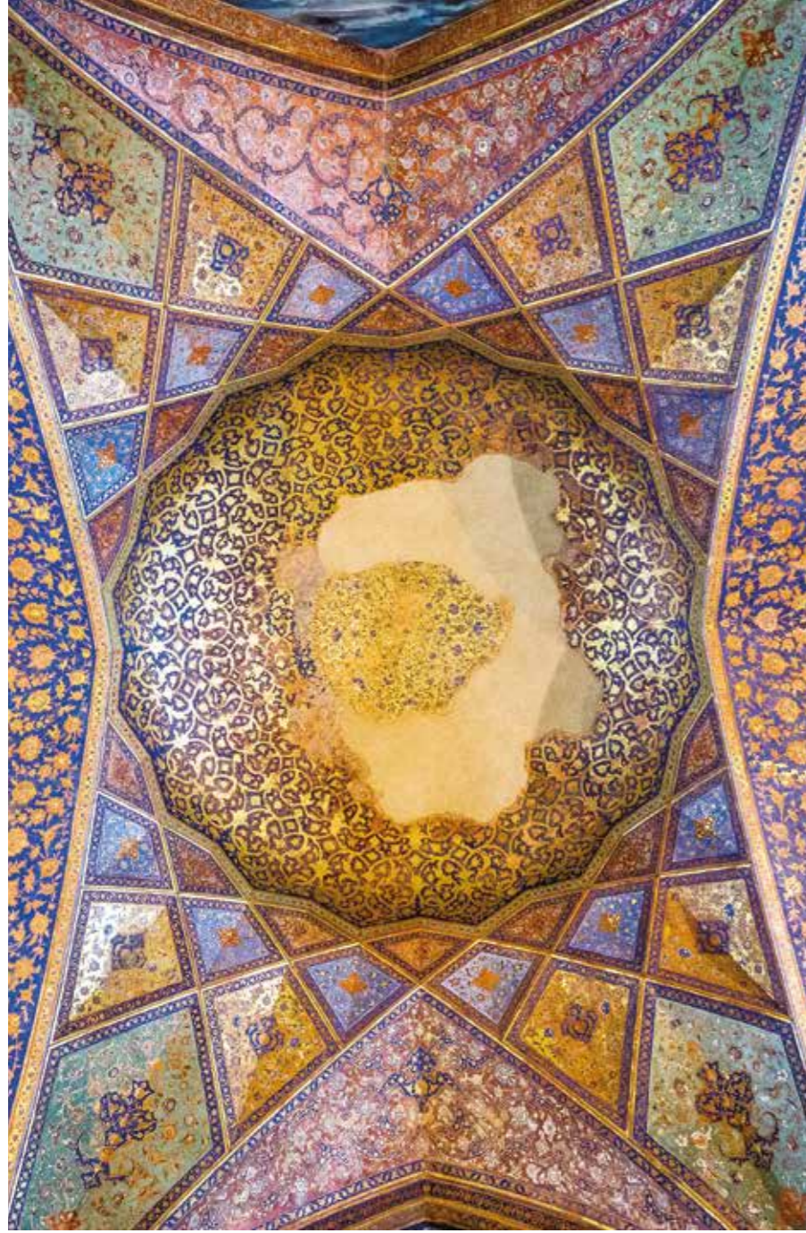
İsfahan, 40 Sütunlu Saray, kubbe içi süslemesi.