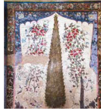
İsfahan, kilise duvar süslemesi.

Birçok araştırmacıya göre minyatür İran'da doğmuş, Çin'de gelişmiş ve Moğollar döneminde İran'da tekrar yaygınlaşmıştır.