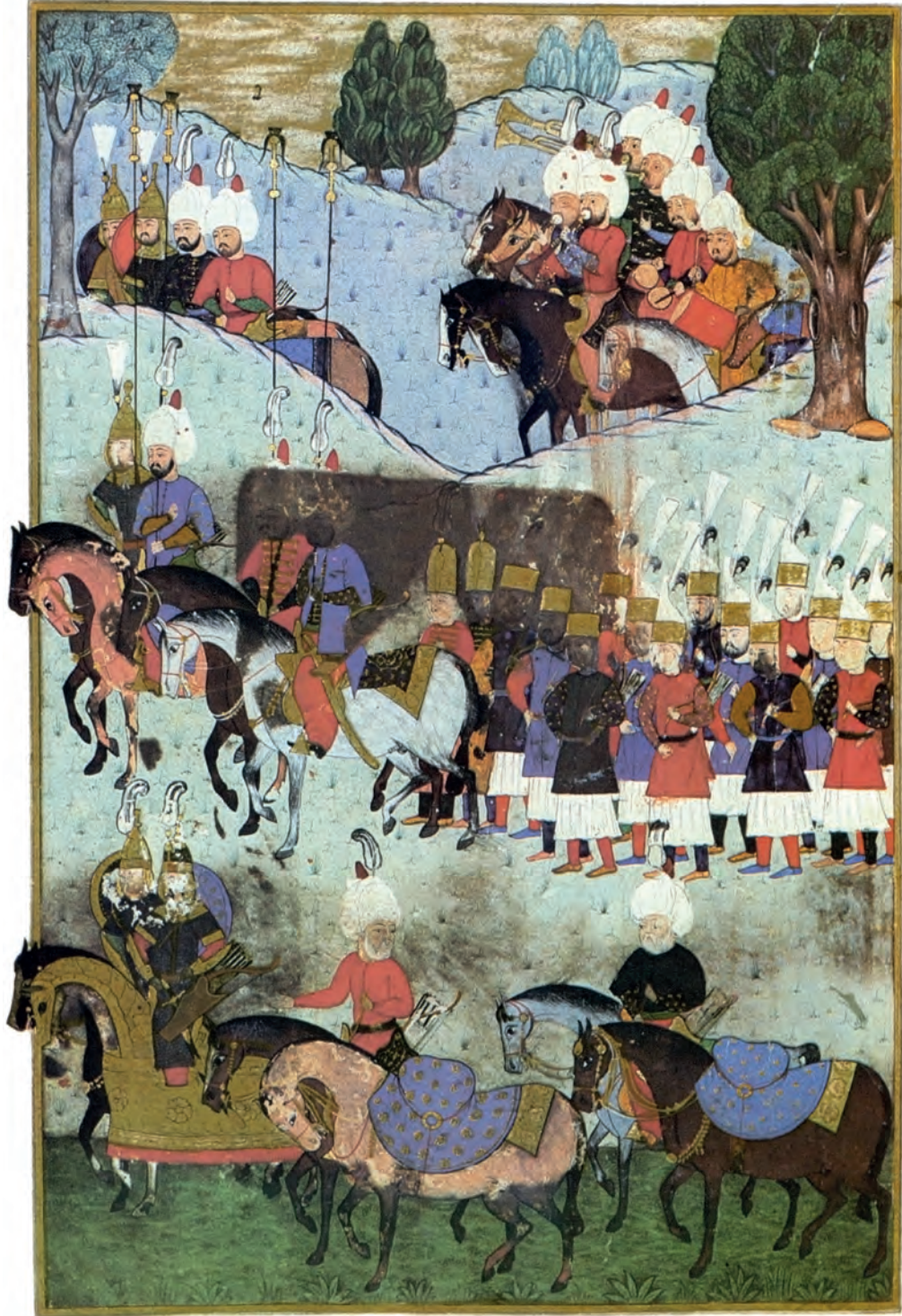
Türk ordusunun Zigetvar seferinden dönüşü, minyatür.

Atabeklerden Arslan Şah ve Emir Şemseddin Atabeg İl-Deniz, Emir Zengi'yi dâvet ederler. Emir Zengi korkup gelemmez, aman verilmesini ricâ eder, elçisi ile türlü hediyelerle birlikte Arap memle-