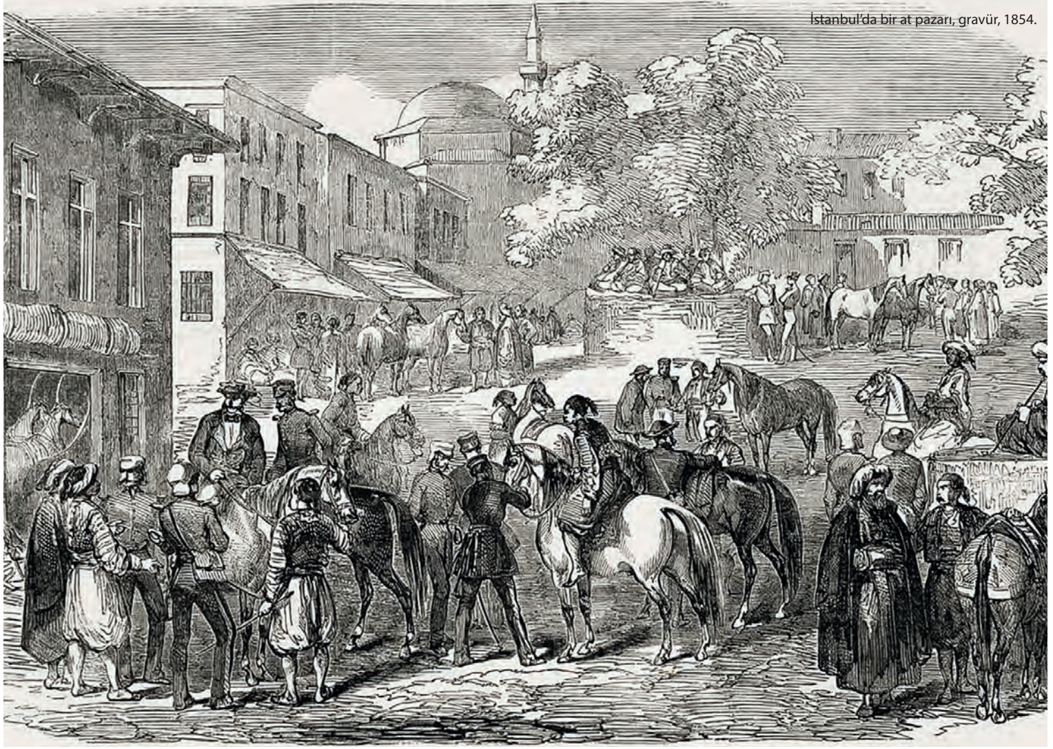
İstanbul'da bir at pazarı, gravür, 1854.

Katırcı ve mekkârî esnafı elindeki kirâlık hayvanları kirâya verdiği zaman “yük taşıma anlaşması” imzâlardı. Ücretlendirme hayvanın taşıyacağı yüke ve gideceği mesâfeye göre belirlenmekteydi. Örneğin Halep'ten Üsküdar'a bir at 225 akçeye giderken, 24 Amasya'ya 70 akçeye gitmekteydi. 25 1582/1583 yılında katırcılar esnafı kirâlık katırların ücretini belirledi; ücretlendirmede standardizasyona gidildi ve üç durum dikkate alındı. Buna göre “mahaffe” 26 ile taşımadan 7, binitten 4, yükten 6'şar altına kirâya verilmesi kararlaştırıldı. 27