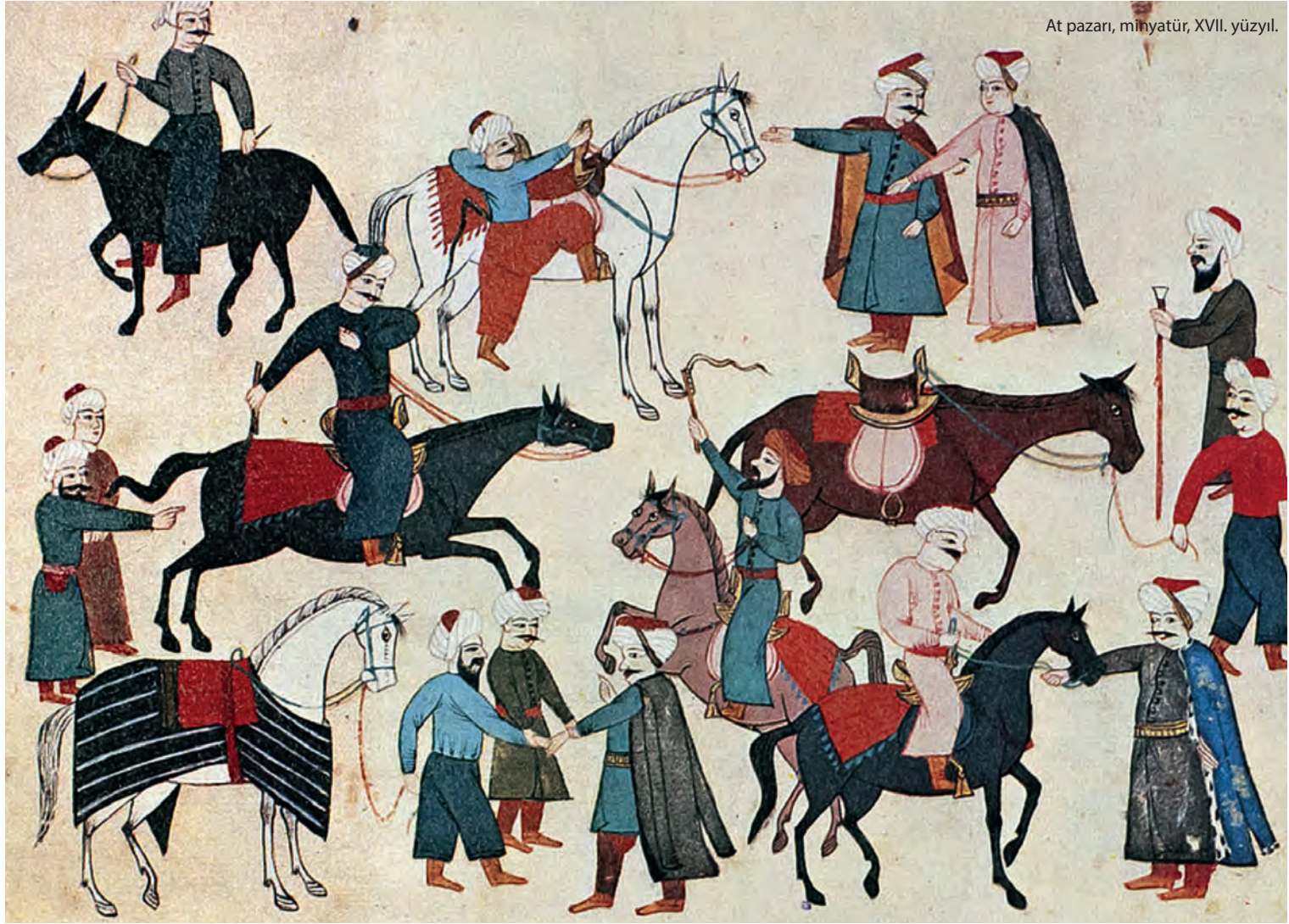
At pazarı, minyatür, XVII. yüzyıl.

yüksek olmakla birlikte Schweigger'ın de gözlemlediği gibi değişkendi. Fiyatı belirleyen birçok faktör vardı. Atın cinsi, yaşı, cinsiyeti, erkek ise iğdiş olup olmama durumu, sağlığı, gücü ve huy özellikleri fiyatına yansırı. 1562 yılında iki at 70 filoriye satılmıştı. 8 Aynı yıllarda Kastamonu kazâsından Recep, ölen kardeşinin kır beygirini katırcıya satmasından dolayı karşılığı olan 12 filoriyi kadı huzûrunda talep etmişti. 9 1563/1564 yılında siyah bir beygir ile al total üç ayağı siğil bir beygir 360 filoriye alıcı buldu. 10 Yakın târihlerde bir satıcı 10 sikke altına bir katır sattığını iddia ederken katır alan katırcı 10 filoriye pazarlık yapıldığını söylemekteydi. 11 Başka bir satışta bir beygire 12 filori ödendi. 12 1564 yılında 9 altına bir katır satışı gerçekleşti. 13 1580 /1581 yılında ise