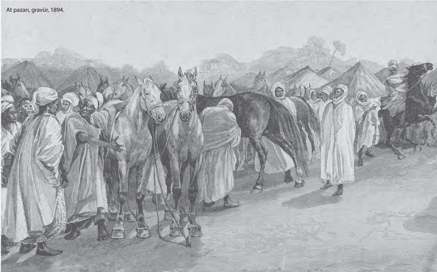
At pazarı, gravür, 1894.

At hırsızlığı menzil, 45 derbent, han gibi toplu yaşama yerlerinin yanında