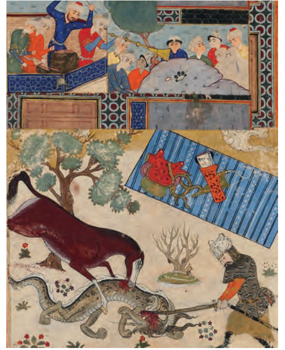
Firdevsî'nin Şehnâme'sinden bir minyatür, XVII. yüzyıl.

Türk kültüründe bu denli öneme sâhip atlar elbette masallarda da yerini almıştır. Özellikle masallarda rastlanan atların göl ya da bataklıkta çıkışı; atların konuşması ve atların insanlara yardımcı olmaları gibi temalar 13 yukarıda değindiğimiz mitolojik ve sembolik unsurlarla örtüşmesi bakımından dikkati çeker. 🐾