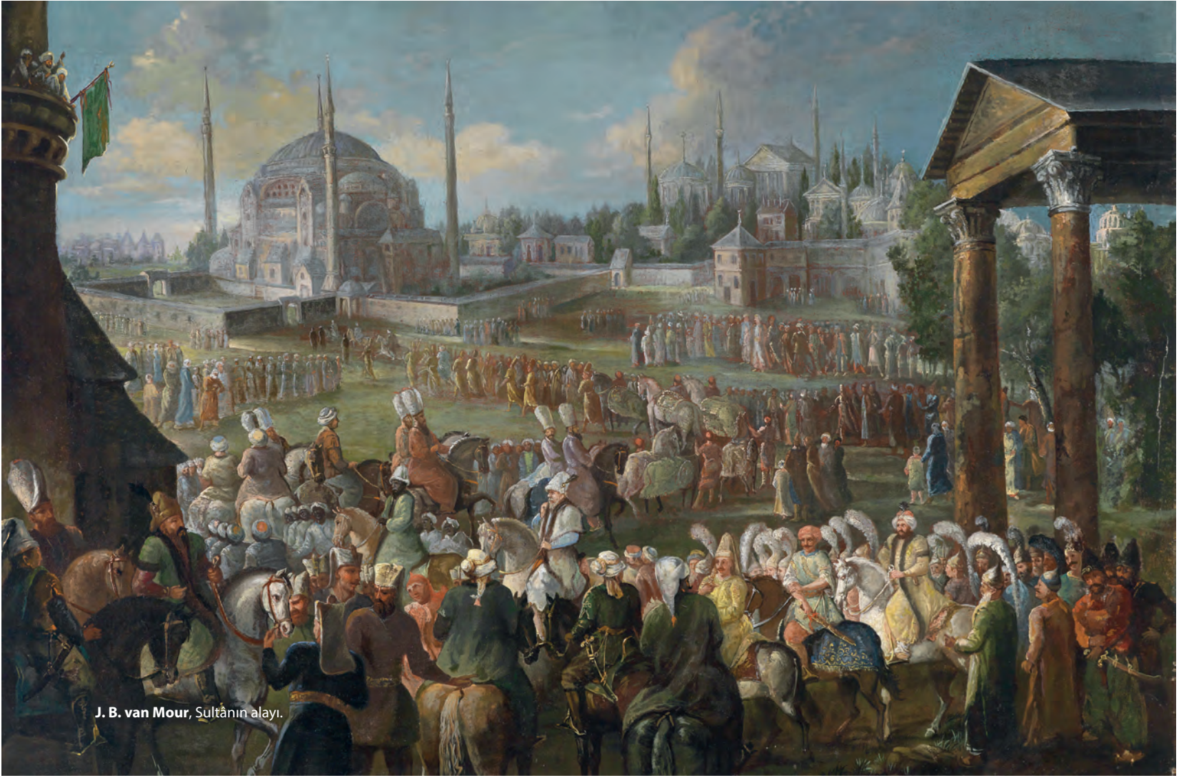
J. B. van Mour, Sultânın alayı.

Günümüzde dahi bu inancın birtakım değişikliklerle birlikte Türklerde devam ettiğinden bahsetmek mümkündür. Örneğin, Erzurum ve Kars'taki bâzı köylerde atın kafatasının ambarların üstüne çakıldığı ya da sırığa geçirildiği gözlemlenebilir. 8