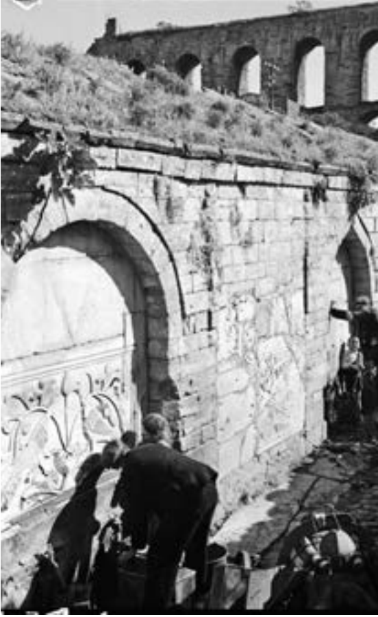
Bir semte adını veren Kırkçeşmeler.

disine bir daha yâr olmayacaktır. Ancak sâdece mermerleri kırılmış ve tezyînâtı parçalanmış olsa da saygı uyandıran hâliyle ayakta kalmaya direnecektir bir müddet. Eyice, çeşmeyi 1946 senesinde bizzat incelediğini söyler. Onun ifâdesiyle “çeşme yarıya kadar toprağa gömülmüş, üst kısmından bâzı parçalar eksilmiş”tir. 1978’e kadar etrâfı çöplerle doldurulmuş, yanı başına dikilen yapıların arasına sıkışıp kalarak âdetâ gözden kaybolan bu yapı, bir zaman sonra parçalanarak tamâmen ortadan kaldırılır. Boş kalan arsası üzerine ise bir apartman kondurulur. Parçaları, İskender Paşa Câmii’nin avlu duvarına herhangi bir numaralandırma ve kayıt altına işlemi yapılmadan öylece bırakılır. Burada yıllarca bekletildikten sonra, yine Eyice’den öğrendiğimize göre, nihâyet Fâtih Câmii civârında bir arsaya gelişigüzel atılarak yok edilir. Bu sûretle klasik devir mîmârî geleneğinden yeni bir üslûba geçişin temsilcisi mâhiyetindeki çeşmenin sonu gelmiştir. Ondandır bize kalan ise son fotoğraflarından okunabilen kitâbe kaydır: