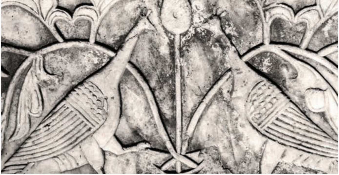
Kırkçeşmeler'in kırık ayna taşı.