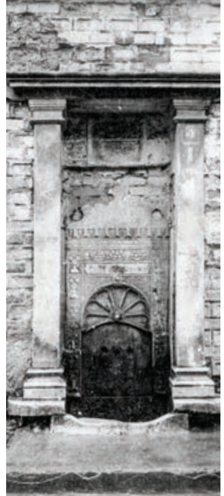
Camcılar Câmii'nin Şekerci sokağına bakan cephesindeki barok çeşme.

Umarız ki bu yazıyla "hayat kaynağı" çeşmelerin bir zamanlar târîhî yarımadanın her sokağında kâim olduğu hatırlanır ve kalan "kayıp yapıların" gün yüzüne çıkarılması için güçlü uğraşlar verilir.