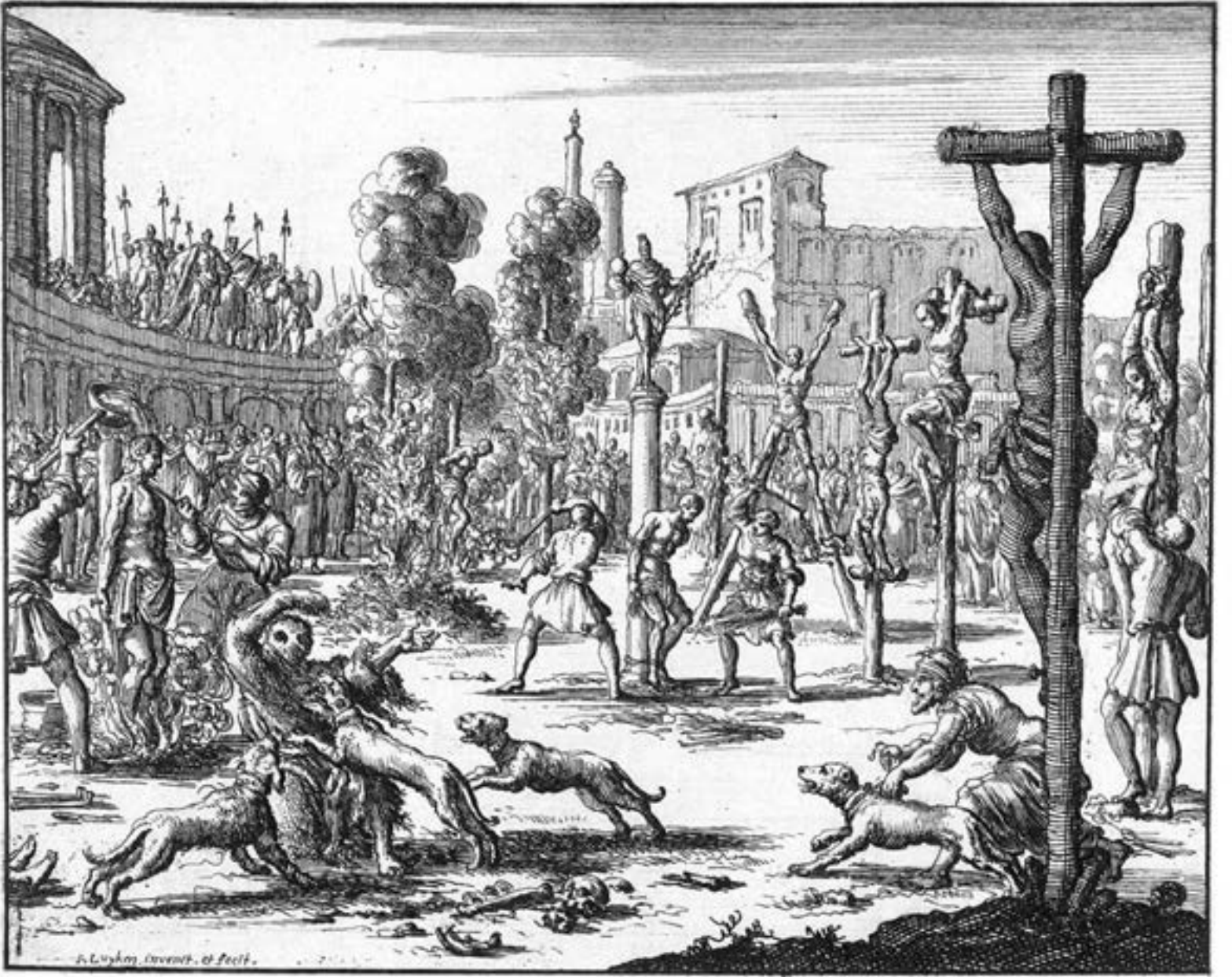
J. Luyken, Roma imparatoru Diocletianus'un Hıristiyanlara yaptırdığı işkenceler, 1685. Rijks Müzesi.

münde, Tanrı tarafından kurulan kutsal "Gökler, yeryüzü ve 'Öz Su'" üçlemesi bu bakımdan ilk Hıristiyanlarca teslîse bir remiz olarak yorumlandı. Gökyüzü Tanrı'ya, her yeri kuşatıcı yeryüzü Kutsal Rûh'a ve dünyâya hayat veren öz su, dünyâya hayat veren Mesîh'e remz edildi. İsa Mesîh'in Vaftizci Yahya tarafından Şeria ırmağında vaftiz edilmesi, Mesîh olmanın en önemli vasfıydı; zîra ancak vaftiz sonrası göklerden gelen bir ses, "Bu benim hoşnutluğumu kazanan sevgili oğlumdur." demiştir.