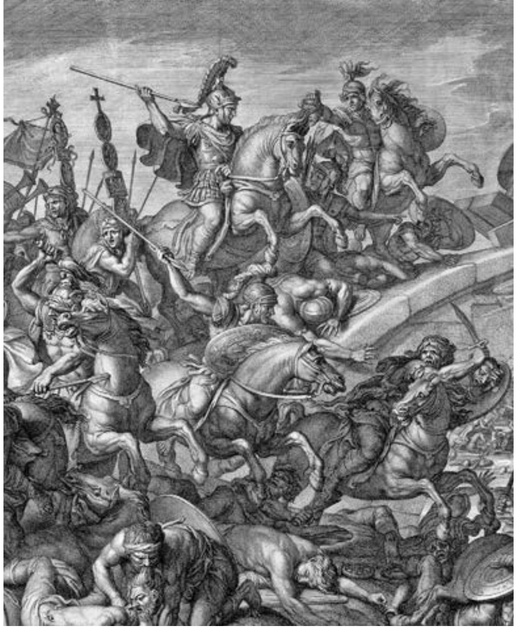
G. Audran / C. Le Brun, Milvian Köprüsü'nde savaş, 1666.

Suyun Mesîh'ten bir parça oluşunun önemli göstergelerinden birisi de Hıristiyanlara vatandaşlık haklarını veren Büyük Konstantin'in Milvian Köprüsü Savaşı'nda rakibi Maxentius'u mağlup etmesi olayıdır. Roma tahtına oturmak için savaştan iki komutandan Konstantin bir pagan olmasına rağmen, ordusunda bulunan Hıristiyanların tanrısından istimdâd dilemiş; hatta askerlerine kalkanları üzerinde bulunan Roma kartallarını kazıtarak yerine Mesîh'i simgeleyen "Labarum" sembolünün çizilmesini emretmiştir. Konstantin'in rakibi Maxentius'un ordusu ise pagan askerlerden oluşmaktadır ve Konstan-