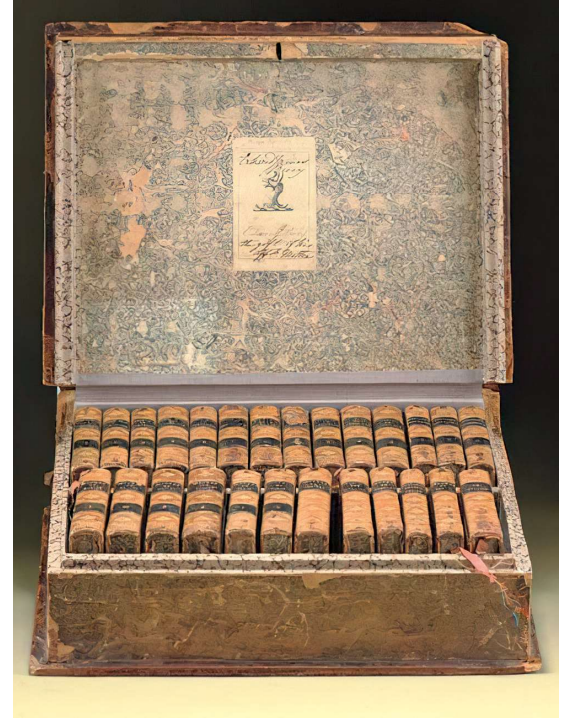
26 cilt kitaptan oluşan seyyar kütüphane.1802.