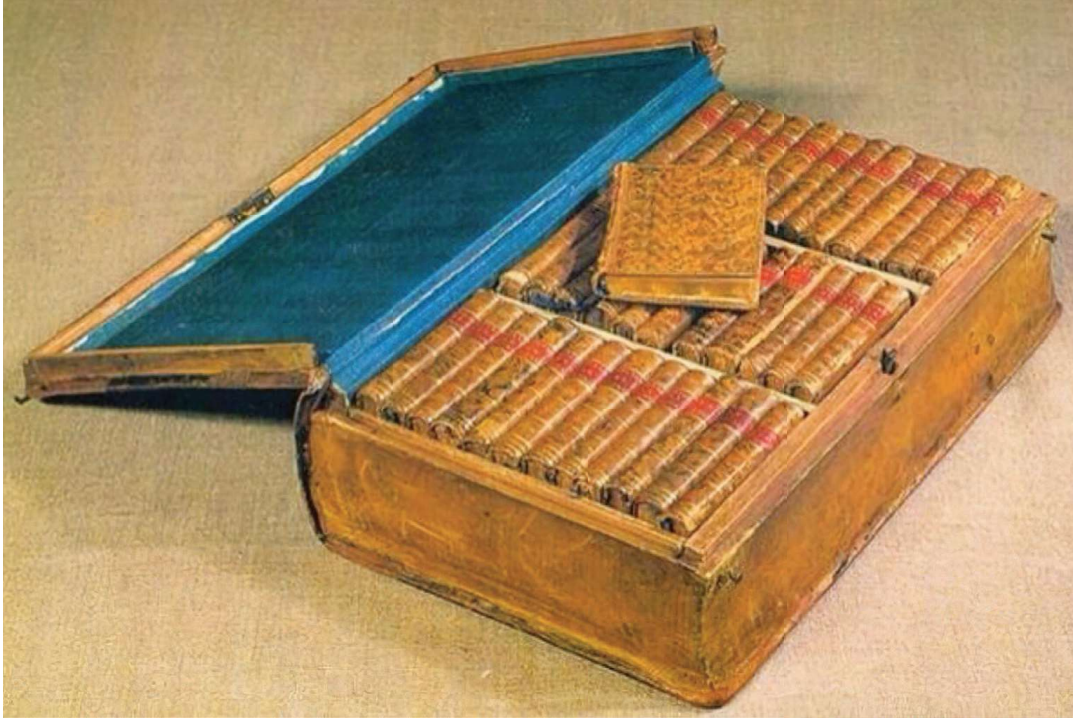
Napoléon'a ait 36 cilt kitaptan oluşan seyyar kütüphanelerden biri.1803.