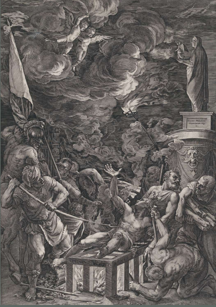
Cornelis Cort. Aziz Lawrence'in ateş üzerinde demir ızgaraya yatırılması. 1571.