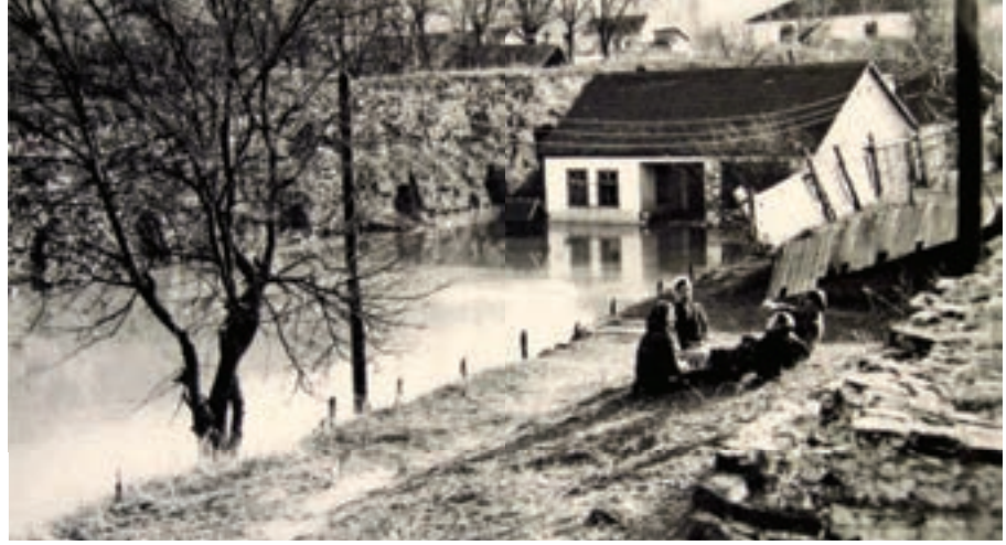
Adakale'den bir manzara.

yorlardı. Bunlar, bilhassa Türk kahvesi ve Türk lokumu satmakla ünlenmişlerdi.