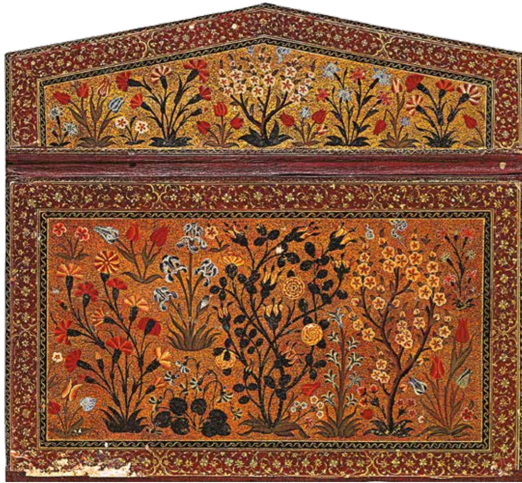
T.S.M. 2851 kayıt numaralı hadis kitabının iç kabındaki lake tekniğindeki has bahçe kompozisyonu.

Caminin iç duvarları, fil ayakları bu ayakları birbirine bağlayan sekiz kemer arasındaki pandantifler, mihrap içi ve çevresi tabandan yaklaşık yedi metre yüksekliğe kadar uzanan binlerce çini karo ile donatılmıştır. Yoğun bir çini programı olan bu eserde İznik kaşı-