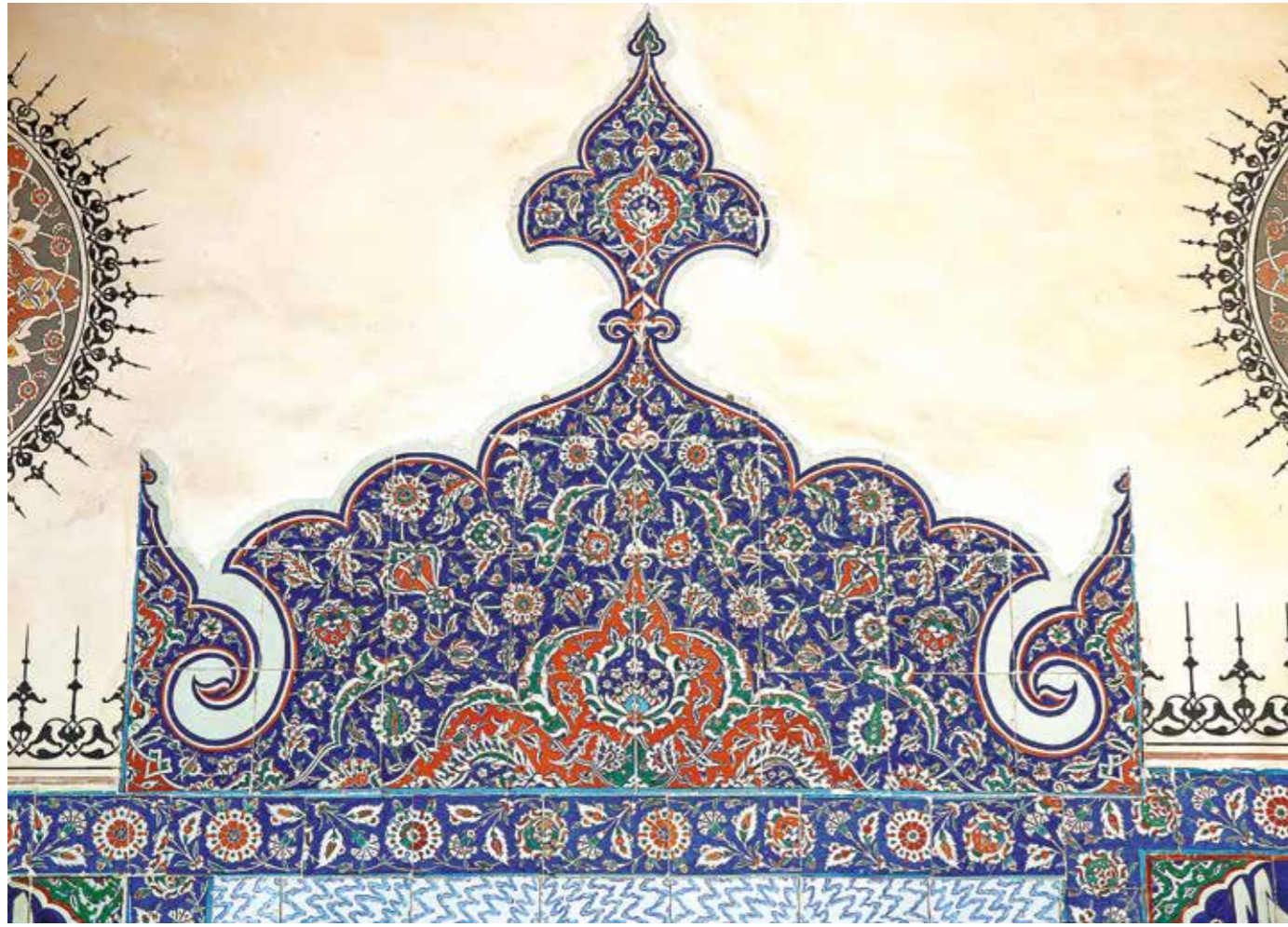
Selimiye Camii çini tasarımları gelenekli rumi ve hatayi motiflerinden yapılmış nakkaşhane üslubundadır.

cilerini uzun bir süre ihyâ ettiği gibi XVI. yüzyıldaki İznik çini sanatının kalkınmasına da önyak olmuştur. Bu devir çinilerinde nakkaşhânenin klasik yorumu ile yeni olan Kara Memi çiçek üslûbu bir arada yer alır. Sadece bu camide lâlenin kırk ayrı çeşidi bulunmaktadır. Çini kompozisyonlarının yanı sıra caminin zengin ahşapüstü kalemşerinde ve mermer oyma desenlerinde de Kara Memi tasarımları hissedilir. Kara Memi imzalı Muhibbî Divânları olmasa, buradan hareket ile diğer yazmalar ve tuğralar hakkındaki düşüncelerimizi bir üstadın çevresinde toplamayacak, belki de devrin nakkaşhâne üslûbudur diye kısa bir cümle ile bitirecektik. Muhibbî divanlarındaki küçücük koltuklarda ve sayfa kenarı halkârîlerinde yaptığı tasarımların mimarî tezyînatların öncesinde küçük eskizler olduğunu düşünüyorum. Yine bu detaylar içinde hurde rûmîler ile yaptığı tasarımların 1560-1590 tarihleri arasında yapılan çini bordürlerde sıkça kullanıldığını görmekteyiz.