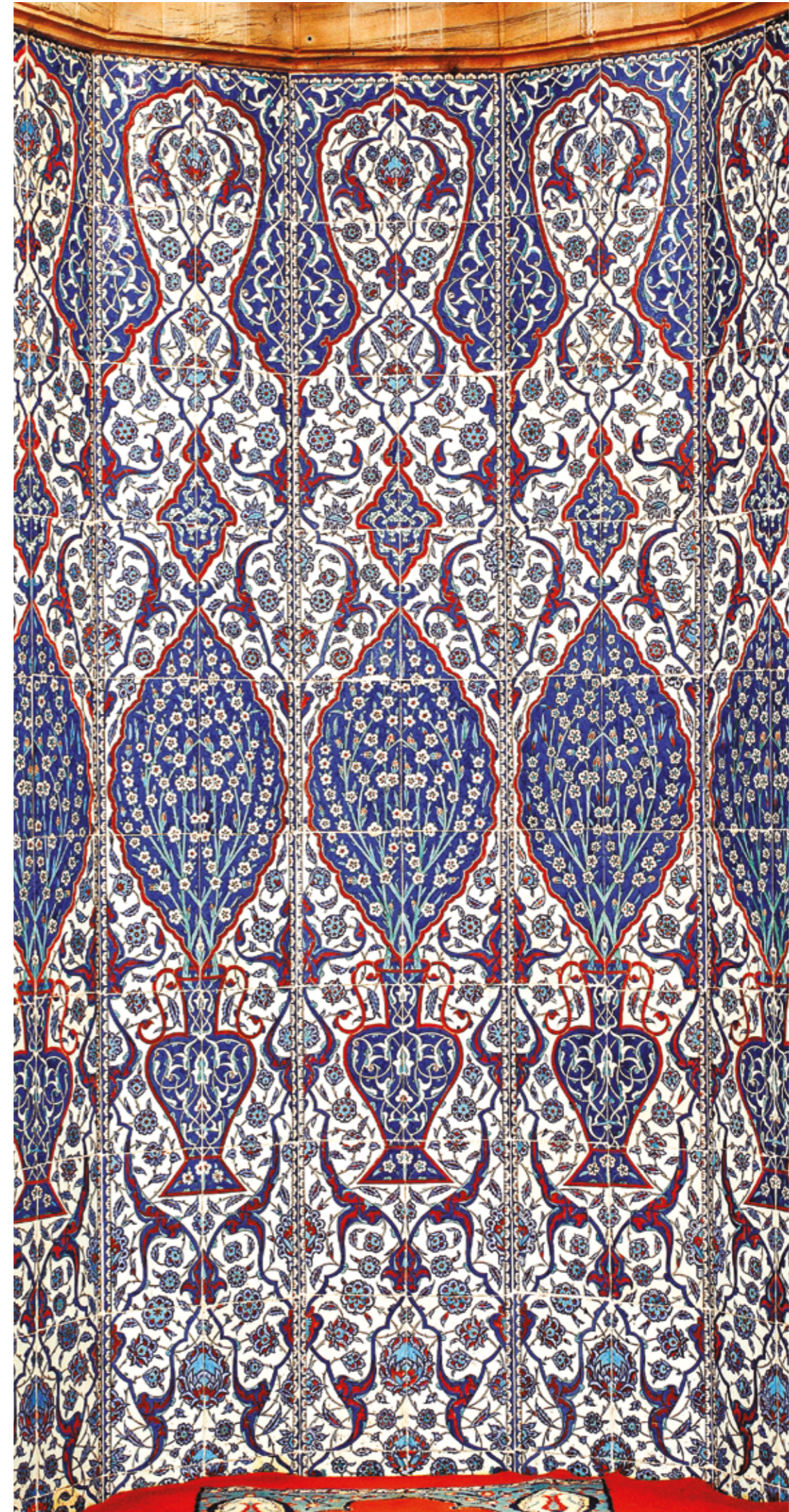
Rüstem Paşa Camii'nin çinili mihrabının vazo içinden çıkan bahar çiçekli şemseleri mihrabı cennet bahçesine çevirir, Mustafa Yılmaz.