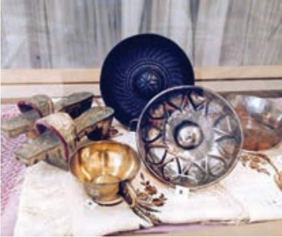
Bayezid Türk Hamam Kültürü Müzesi'nden.

İstanbul'un fethinin ardından şehirde inşâ edilen ikinci selâtin câmi ve külliyesi olan II. Bayezid Câmii ve külliyesi, şehrin Bizans devrindeki en büyük meydanı olan "Forum Theodosiacum" veya "Forum Tauri"nin bir köşesinde XVI. yüzyılın hemen başında vücûda getirilmiştir. Câmi, türbe, imâret, sıbyan mektebi, tabhâne, medrese, kervansaray ve hamamdan müteşekkil olan ve bu külliyenin önemli bir parçasını oluşturan çifte hamam, Türk hamam mîmârîsinin erken târihli ve görkemli bir örneği olarak karşımıza çıkmaktadır. Sultan II. Bayezid (1481-1512) tarafından inşâ ettirilene bu hamamın o sırada Trabzon Sancakbeyi olan Şehzâde Selim'in (Yavuz) vâlidesi Gülbahar Hatun'un Trabzon'daki imâretine vakıf geliri olarak tahsis edildiği bilinmektedir. 1