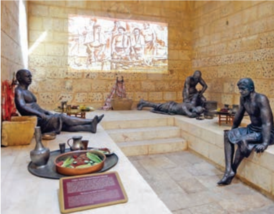
Gaziantep Hamam Müzesi.

ve kültürel mirâsında hamamların önemini, bu yapıların şehrin mîmârî dokusunda yerini ortaya koymak ve unutulmaya yüz tutan hamam kültürünün gelecek nesillere aktarılmasını sağlamak amacıyla, Paşa Hamamı binâsının Hamam Müzesi'ne dönüştürülmesi planlanmıştır. Bu amaçla Hamam Müzesi'nin projesi hazırlanmış olup teşhir tanzîmi işi için ihâlesi yapılmış ve yer tesliminin yapılmasıyla da uygulamaya başlanmıştır. Târihî, kültürel ve sosyal açıdan şehir belleğinde önemli yeri olan hamam kültürüne dâir yerel, ulusal ve yabancı tüm araştırma ve yayınlarından faydalanılarak oluşturulan müze içerisinde; su kültürü, hamam kültürünün kökeni ve târihsel gelişimi, Türk hamamları, Gaziantep hamamları ve hamam mîmârîsi, hamam âdâbı, tellak, natır, erkek hamamı, güvey hamamı, gelin hamamı, lohusa hamamı, hamamda kız bakma, beraberindeki yeme içme ve eğlence kültürü gibi konular bal mumundan yapılmış mankenler, kiosklar, panolar, özel vitrinlerde sergilenen hamam eşyası, led ve dokunmatik ekranlar yardımı ile anlatılmaktadır.