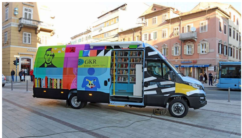
Bibliobus Koper: kp.sik.si