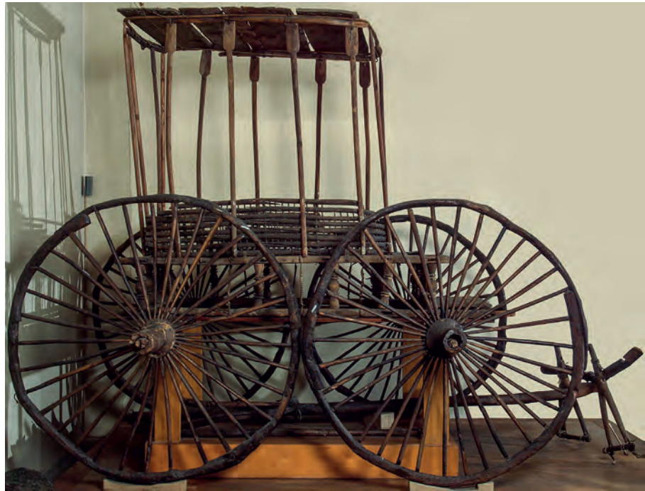
İki at tarafından çekilen, savaş ve yarışlarda kullanılan araba, V-IV. yüzyıl, Pazırık. Hermitage Müzesi.