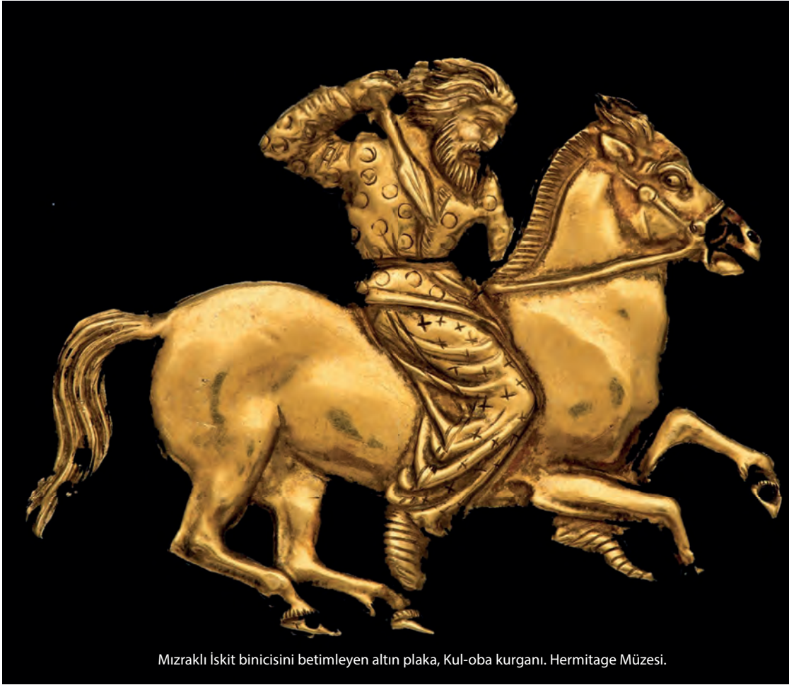
Mızraklı İskit binicisini betimleyen altın plaka, Kul-oba kurganı. Hermitage Müzesi.

larını, kanlı göz yaşı döktüklerini ve aynı davranışı, mezar inşâ edilip ceset veya külleri toprağa gömüldüğü esnâda da tekrarladıklarını anlatıyorlar. 18