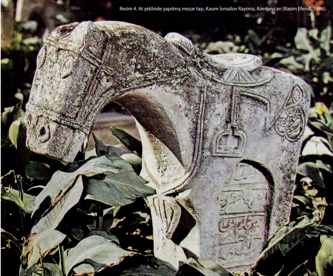
Resim 4. At şeklinde yapılmış mezar taşı, Kasım İsmailov Rayonu, Azerbaycan (Rasim Efendi, 1986).

Atların ölümüyle ilgili geleneklerden biri de mezar taşlarıdır. Bilinen at