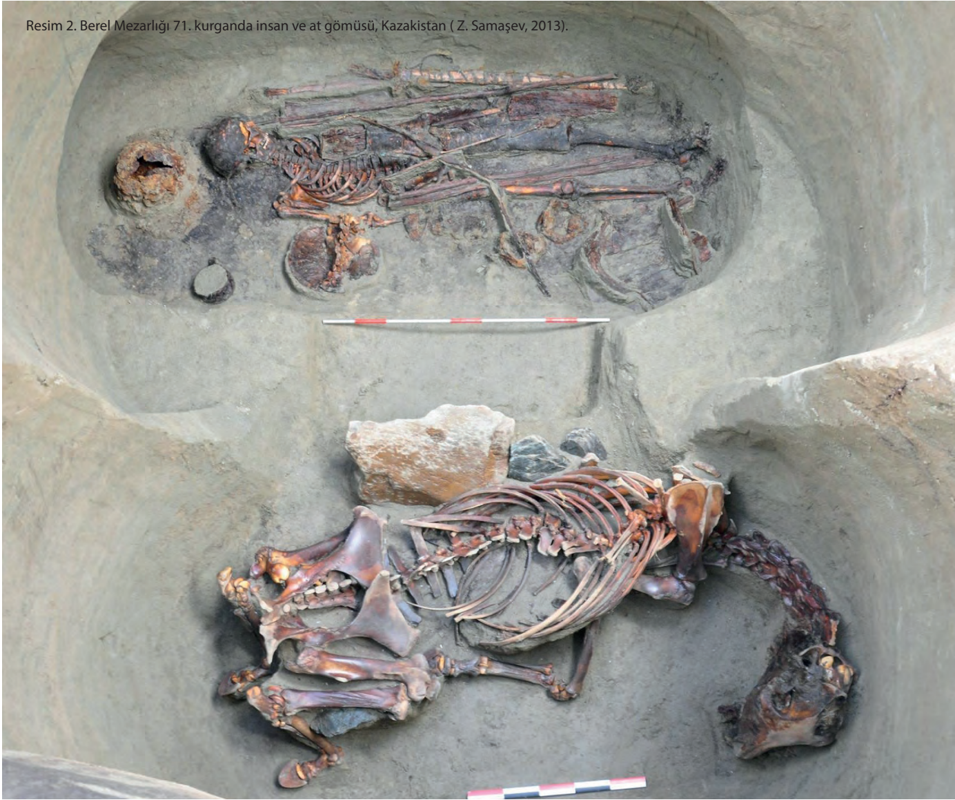
Resim 2. Berel Mezarlığı 71. kurganda insan ve at gömüsü, Kazakistan ( Z. Samaşev, 2013).

leştirildiğini ve yavaş yavaş definlerde de yer almaya başladığını gösterir.