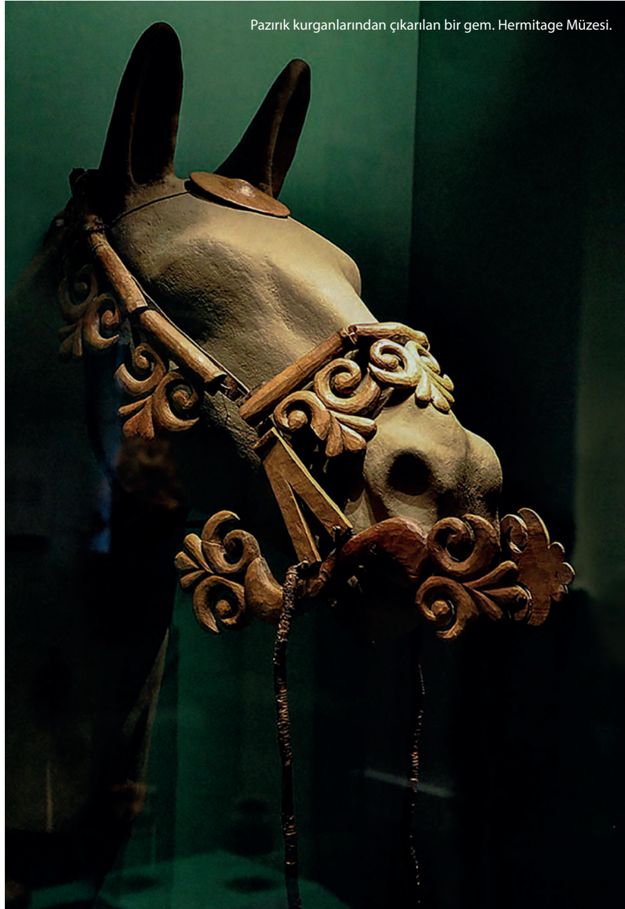
Pazırık kurganlarından çıkarılan bir gem. Hermitage Müzesi.

Avrupalı ve Amerikalı araştırmacıların İskit olarak diğer Türklerden ayırdığı (hatta İran kökenli saymaya çalıştıkları) toplulukların ve Hunların (Hsiung-nu) kurganlarında atların çok sayıda ve ço-