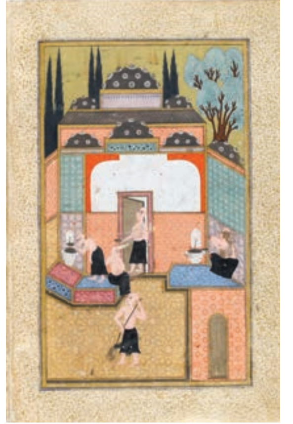
Hünernâme, Topkapı Sarayı Müzesi, envanter no H1524 / 148a.

Âyînedarlar Hamamda yıkanıp temizlenen, saç sakal tıraşı olan müşte- riye, ayna tutarlardı. Müşteri kendisini güzelce kontrol ettikten sonra âyînedar aynayı ters çevirir, bu yolla müşteri-