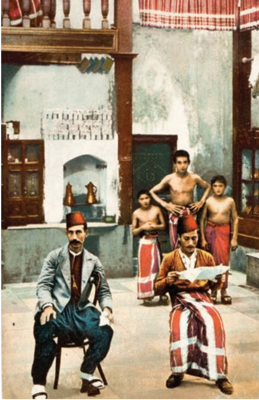
Erkekler hamamı, kartpostal, İstanbul. XIX. yüzyıl.

na, halk arasında “güveyi hamamı”, “güveyi çimme günü” de denmektedir. Düğünden bir gün önce dâmat, arkadaşları ve akrabaları berâberce yıkanmaya giderdi. Bâzen hamamlar, o gece sâdece bu misâfirler için kapatılırdı. İkramlar yapılır, duâlar edilir, dâmâdın akrabaları ve hocalar tarafından kendisine âile hayâtıyla ilgili bilgiler aktarılırdı. Ermeni âilelerin dâmat hamamı geleneğinde dâmâdın kafasında yumurta kırma ve arkadaşları arasında yumurta savaşının yapılması, âilenin neslinin bol ve bereketli olmasını dilemek mânâsındaydı. Bu gelenekler bugün de devam etmekte olup İstanbul hamamlarında zaman zaman rastlan-