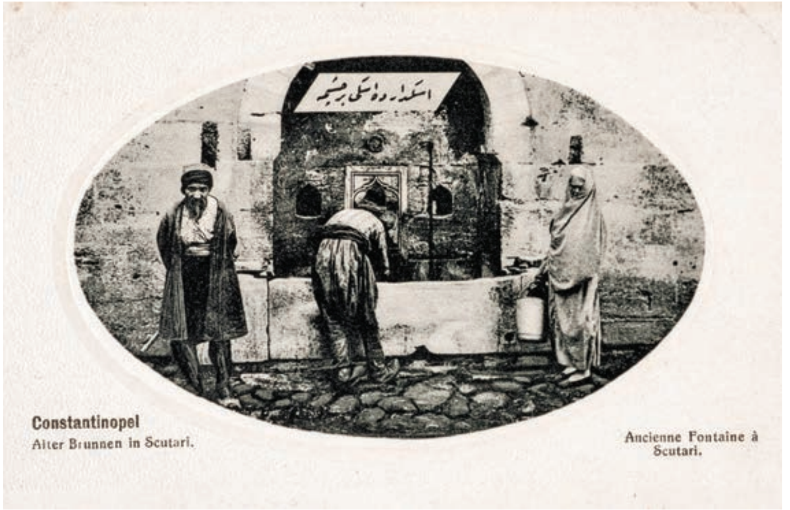
Constantinopel Alter Brunnen in Scutari.