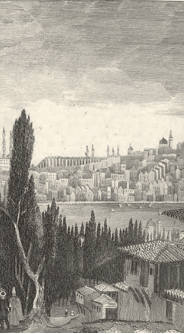
T. Allom, Pera'da Çeşme.