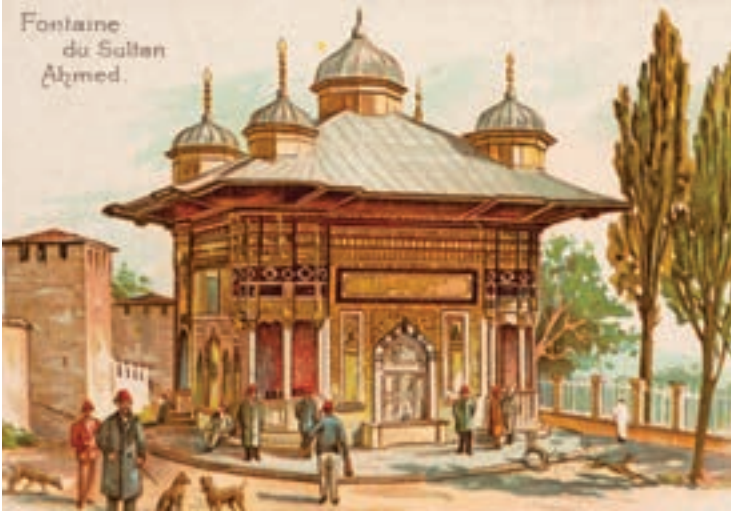
(alt) Sultan Ahmed Çeşmesi.