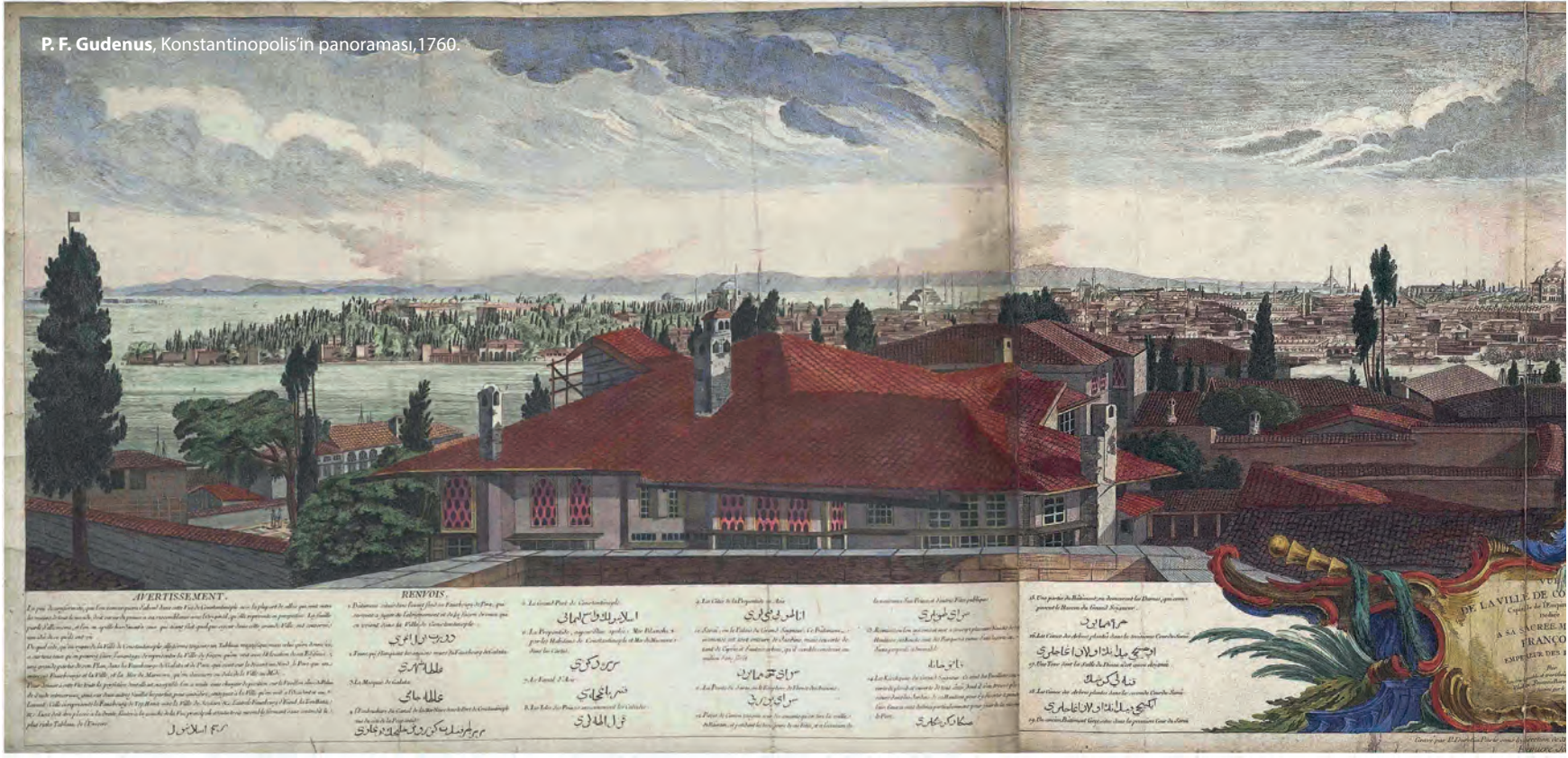
P. F. Gudenus, Konstantinopolis'in panoraması, 1760.

yan Osman Efendi Mescidi'nin yerine yapıldı. Bu mescidin bânisi olan Osman Efendi, bir Celvetî şeyhiydi ve bu semtte yaptırmış olduğu mescit, kendisine "Atpazarı" şeklinde bir unvan kazandırmıştı.