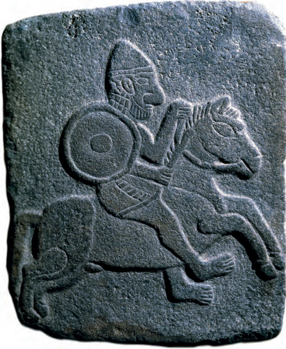
Kral Kapara sarayından atlı bir askeri gösteren kabartma, MÖ X. yüzyıl. British Museum.

İskitlerin Yakındoğu'da yarattığı yönetim boşluğunu sona erdiren Persler, atı ve atlıları, tıpkı bozkırın çoban kültürleri gibi temel bir konuma yükselttiler. Adı Pers dilinde "Güzel Atlar Ülkesi" anlamına geldiği kabul edilen Kappadokya'dan, vergi mâhiyetinde atlar ve katırlar aldılar. Herodot'ta en büyük Pers kralı olarak kabul edilen ve MÖ 522-486 yılları arasında hüküm süren Darius'un, tahtında atının sâyesinde oturabildiğini anlatan bir pasaj vardır: