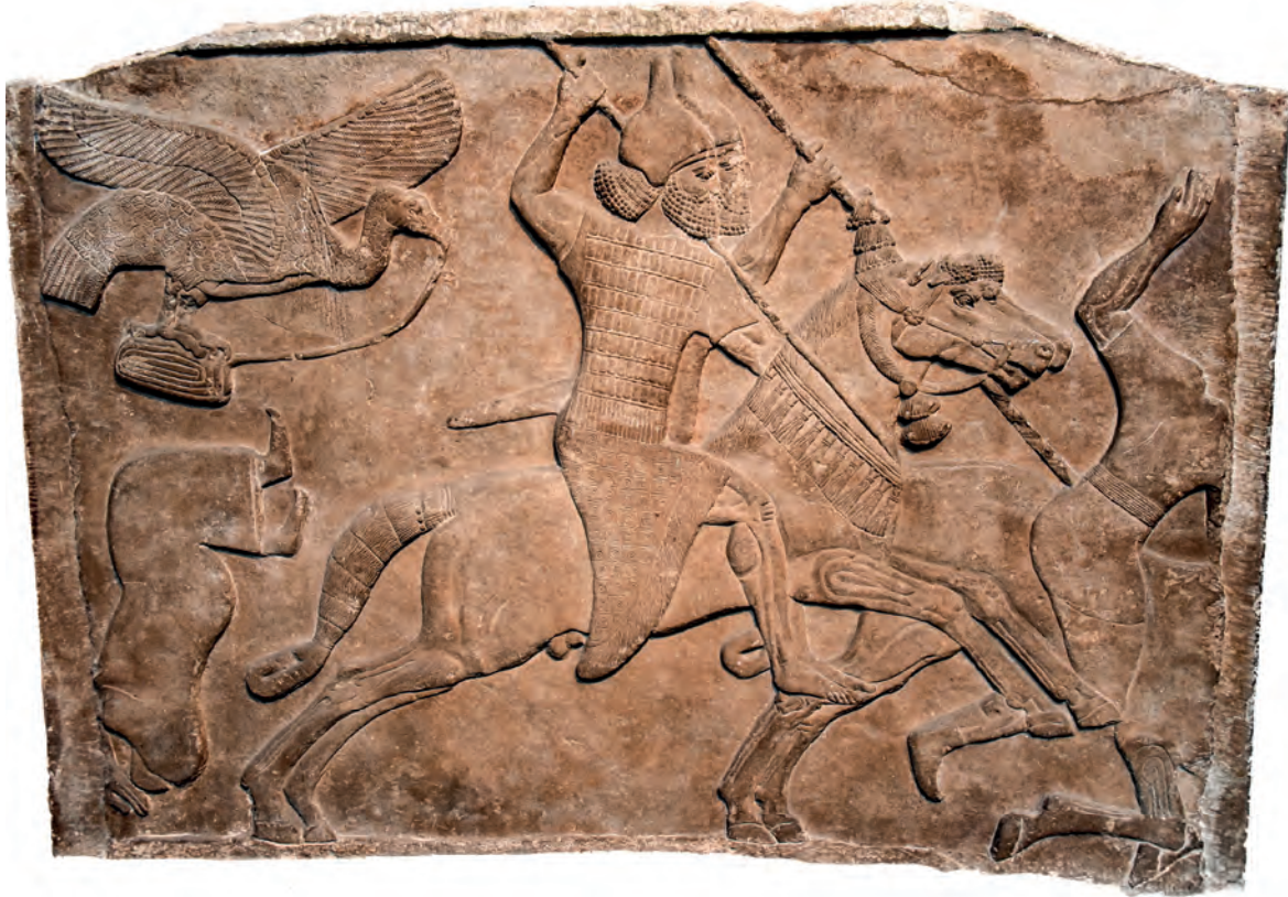
Asurlulara âit bir tablet, MÖ 728. British Museum.

4 bin yıl öncesinde yerleşik büyük şehir medeniyetleri vücûda getirmiş