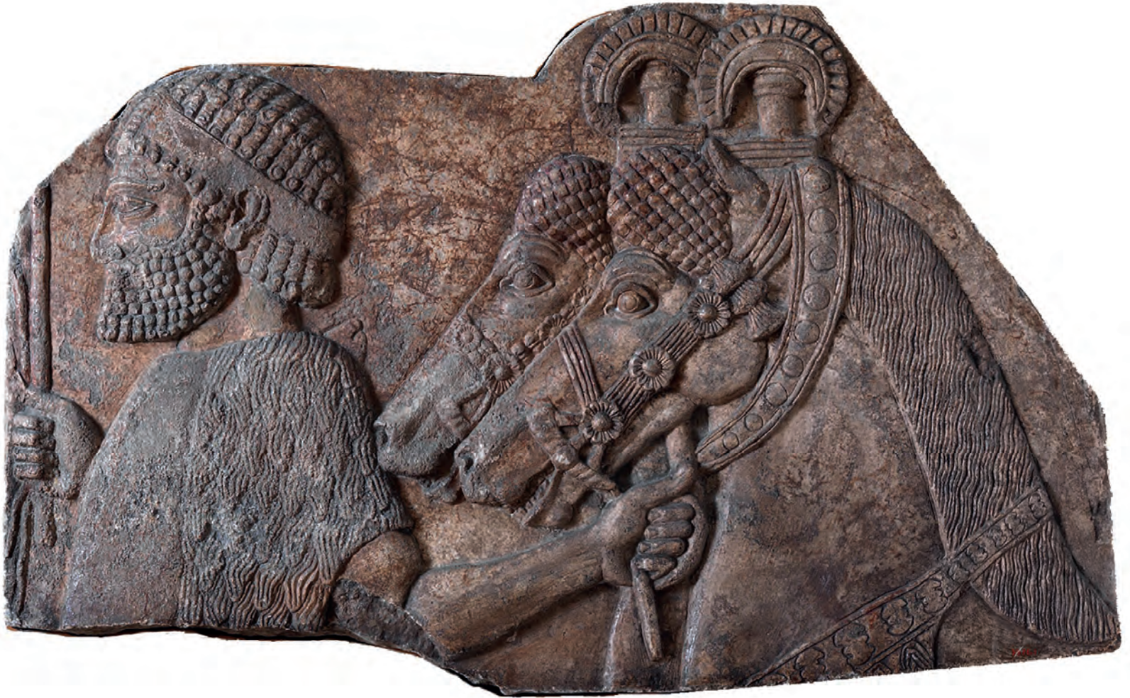
Taş kabartma, MÖ 721-705. Metropolitan Sanat Müzesi.

nin en hızlı yolu, daha sonraları savaş meydanlarında zafer kazandırıcı arabaların çekicisi ve en son olarak da insanla birlikte göğüs göğüse savaşan bir yoldaş olmuştur. Bu istisnâî birlikteliğin büyüğü güzelliği çoğu zaman edebiyâta ve görsel sanatlara da yansımıştır. At insanı onurlandırırken, insan da atı anıtlıştırmıştır.