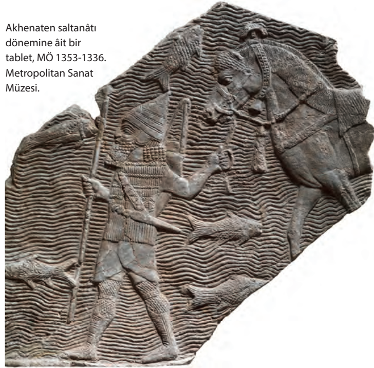
Akhenaten saltanâtı dönemine âit bir tablet, MÖ 1353-1336. Metropolitan Sanat Müzesi.

gerekse Med imparatorluğu ordusu için yaptıkları gibi paralı asker olarak MÖ I. binyıl boyunca pek çok devlet ve topluluk için korku unsuru olmuştur.