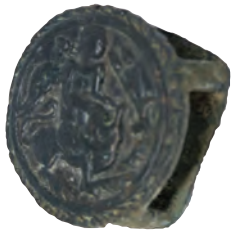
Roma dönemi, bronz at kayış taşıyıcısı.