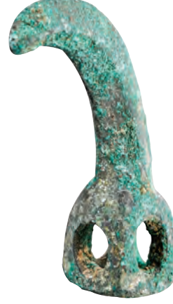
İskit, bronz at kayış taşıyıcısı.