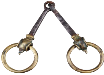
Osmanlı, İstanbul üretimi bronz at gemi.