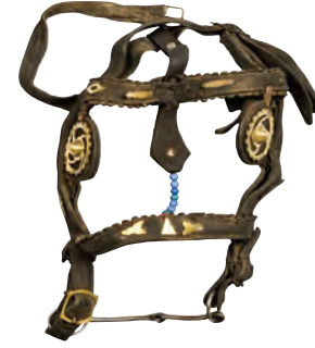
XX. yüzyıl, piriñç at gemi ve deri at başı bağlantıları.