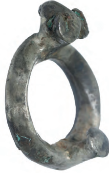
Luristan, bronz at kayış taşıyıcısı.