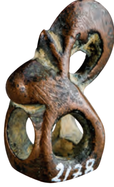
İskit, bronz at kayış taşıyıcısı.