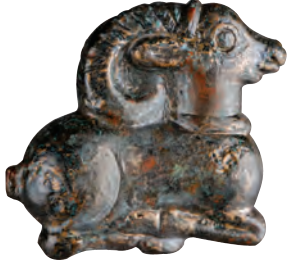
İskit, bronz at kayış taşıyıcısı.

Deri kayışların atın değişik bölgelerine yönelmesini sağlayan aksesuarlardır. Ufak boyutlu olmakla birlikte, at koşumlarının hayâtî öneme sâhip parçalarıdır.