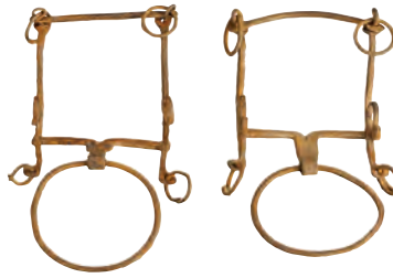
XX. yüzyıl, demir at gemi.