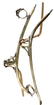
At kayış bağlamaları.