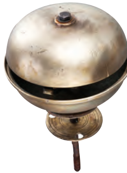
Pirinç fayton zili.