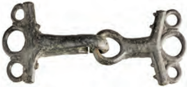
Helenistik dönem, bronz at gemi.