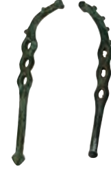
Urartu, bronz at gemi.