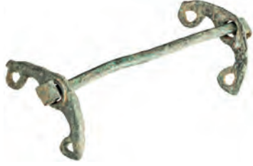
Demir Çağı (Luristan), bronz at gemi.

Atı kontrol altında tutup hareketlerini yönetebilmek (döndürüp durdurulabilmek) için ağzına takılan mâdenî bir objedir.