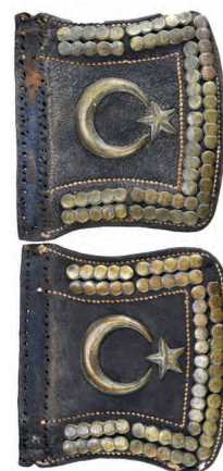
At gözü siperleri.