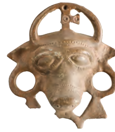
Son Roma (Bizans) dönemi, bronz at kayış taşıyıcısı.