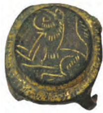
Roma dönemi, bronz at kayış taşıyıcısı.