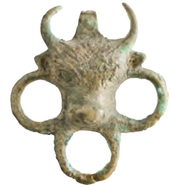
Son Roma (Bizans) dönemi, bronz at kayış taşıyıcısı.