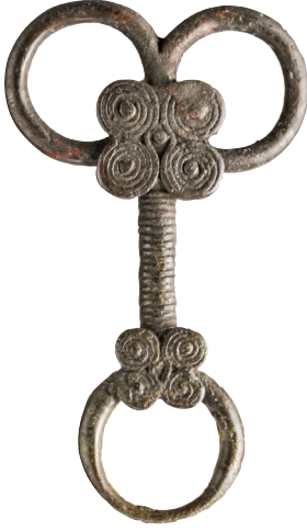
Luristan, bronz at kayış taşıyıcısı.