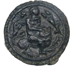
Roma dönemi, bronz at kayış taşıyıcısı.