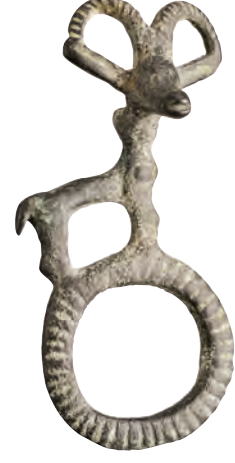
Luristan, bronz at kayış taşıyıcısı.