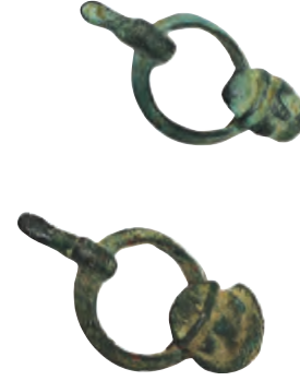
Luristan, bronz at kayış taşıyıcısı.