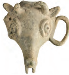
Son Roma (Bizans) dönemi, bronz at kayış taşıyıcısı.