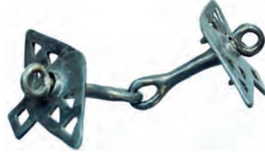
Demir Çağı, bronz at gemi.