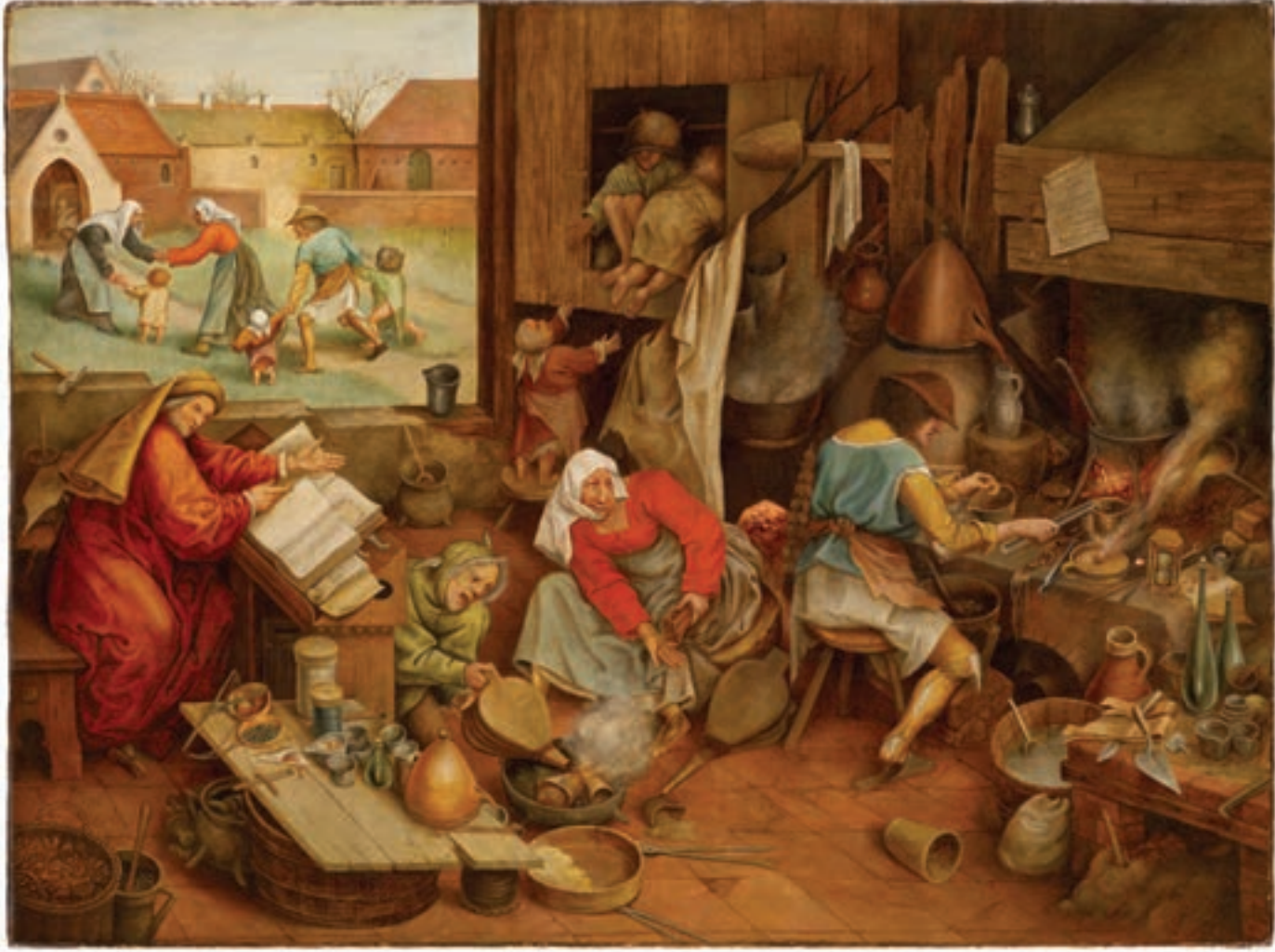
P. Brueghel, Simyacı, 1600'ler. Leiden Koleksiyonu.

zehirlenerek öldüğü de klasik metinlerde geçmektedir.