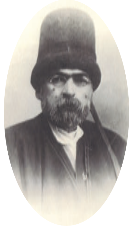
Hüseyin Fahreddin Dede.

Musiki tahsiline İzmir'de 10 yaşlarında iken mandolin çalarak başladı. Bir süre sonra Şeyh Cemal Efendiden ud ve Türk musikisi dersleri aldı. İstanbul'a döndüğünde bestekâr udi Şekerci Cemil Efendiden musiki bilgisini ilerletti. Ayrıca ney, piyano ve diğer bazı nefesli ve yaylı sazları öğrendi. 1907-1909 yıllarında ünlü besteci ve musiki bilgini Edgar Manas'tan armoni, kontrpuan ve fûg dersleri aldı. Başta Şeyh Hüseyin Fahreddin Dede olmak üzere çeşitli üstatlardan Türk klasik müziği ve dinî musiki meşketti. Özel musiki toplantılarının birinde Suphi Ezgi ile tanıştı ve onunla hayat boyu sürecek bir musiki arkadaşlığına başladı. Dârüttalim-i Musiki'nin öğretim kadrosunda yer aldı. Ayrıca çok sesli musiki ile meşgul oldu. Bir yeniliği gerçekleştirerek soprano, alto, tenor, bas, kontrbas olmak üzere beş ayrı boy kemeçe imal ettirdi. Bu sazlar için dörtleme ve beşlemeler besteledi. İstanbul Şehir Umumi Meclisince İstanbul Konservatuvarı Batı Musikisi Bölümünün düzeltilmesi ve 1926'da kapanan Türk Musikisi Bölümünün yeniden açılması için büyük yetkilerle İlmî Kurul reisliğine getirildi. Burada Türk musikisi nazariyatı ve tarihi dersleri verdi. Türk Musikisi İcra Heyeti adıyla bir topluluk kurdu. Konservatuvarın Batı Musikisi bölümünü orta derecede bir Avrupa konservatuvarı seviyesine ulaştırdı. Belediye Konservatuvarından ayrıldıktan sonra İleri