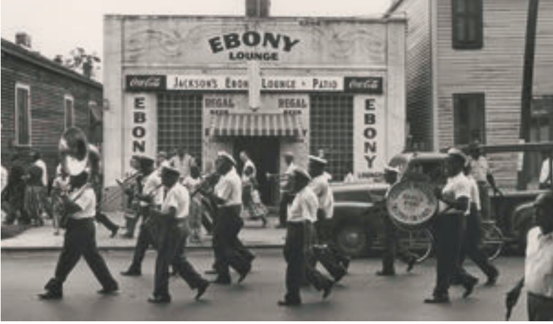
New Orleans Marş Bandosu (1960).