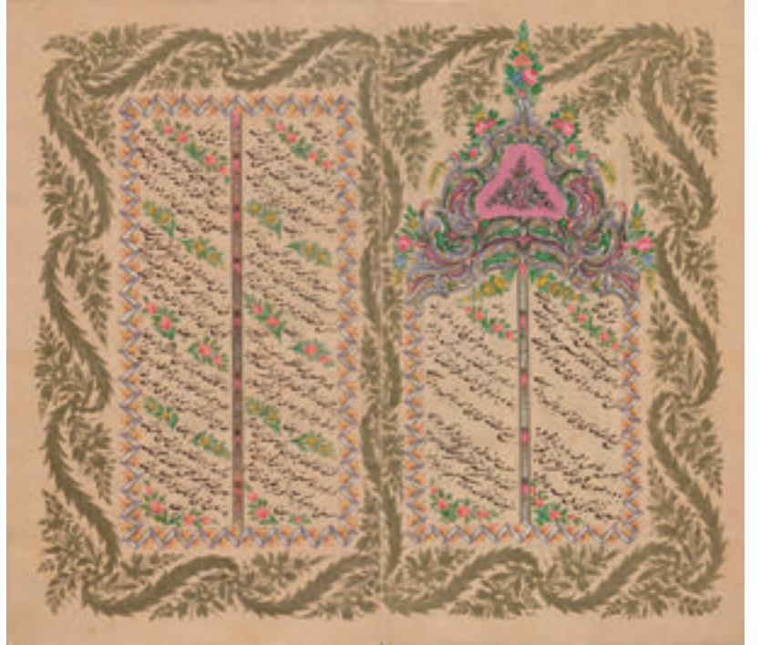
TY 5649, 91b-92a.