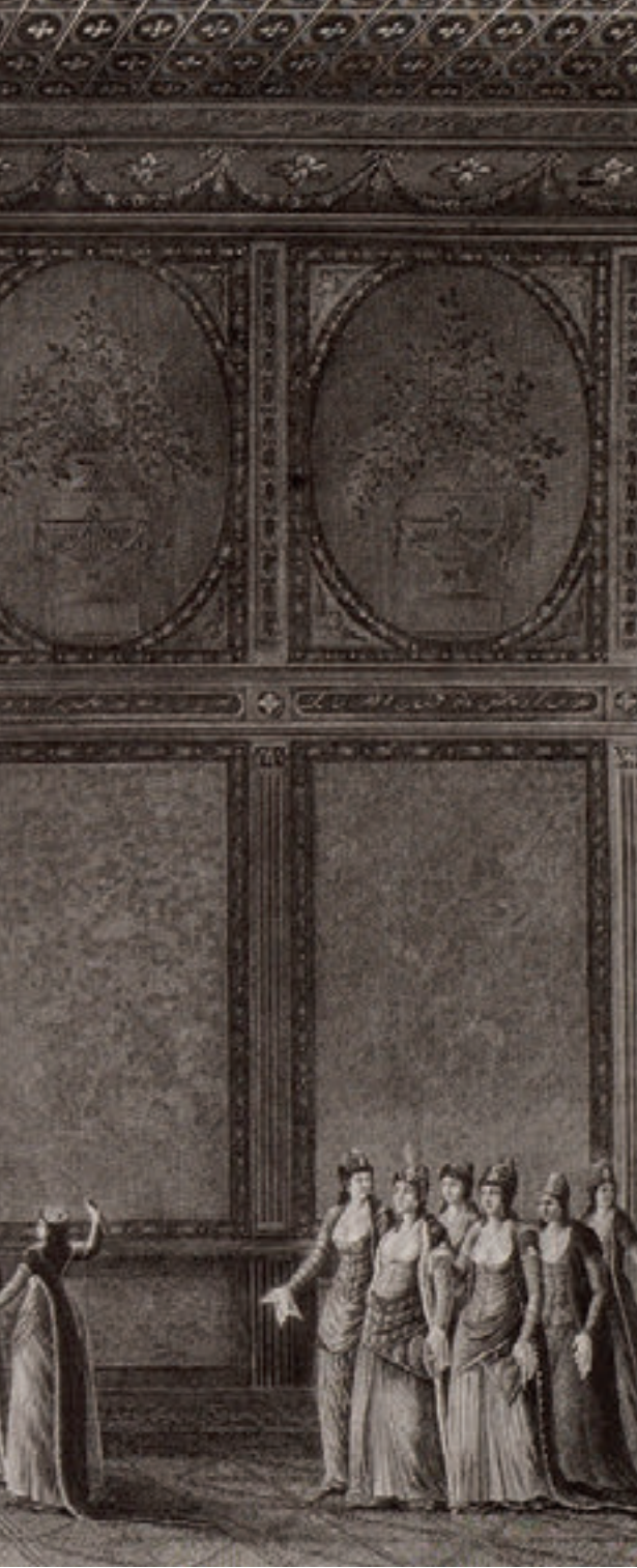
Antoine Ignace Melling. Topkapı Sarayı hareminded, III. Selim'in kızkardeşi Hatice Sultanın odasının hayali tasviri. Catherine Laskaridis Vakfı Kütüphanesi.

sahnesine çıkmasıyla nam salması bir olmuştur. Eserleri sürekli icra edilmiş, bazı eserleri, bestelendiği makamın repertuarında mühim yer edinmiştir. Hatta gün gelmiş, bu bestekârın isminin şöhreti, başka eserlerin de ona atfedilmesine sebep olmuştur. Bu efsanenin ismi Dilhayat'tır.