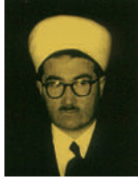
Hafız Esad Gerede.