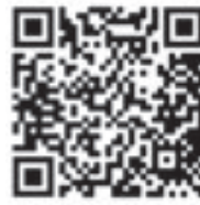
Kani Karaca, Rast ezan.