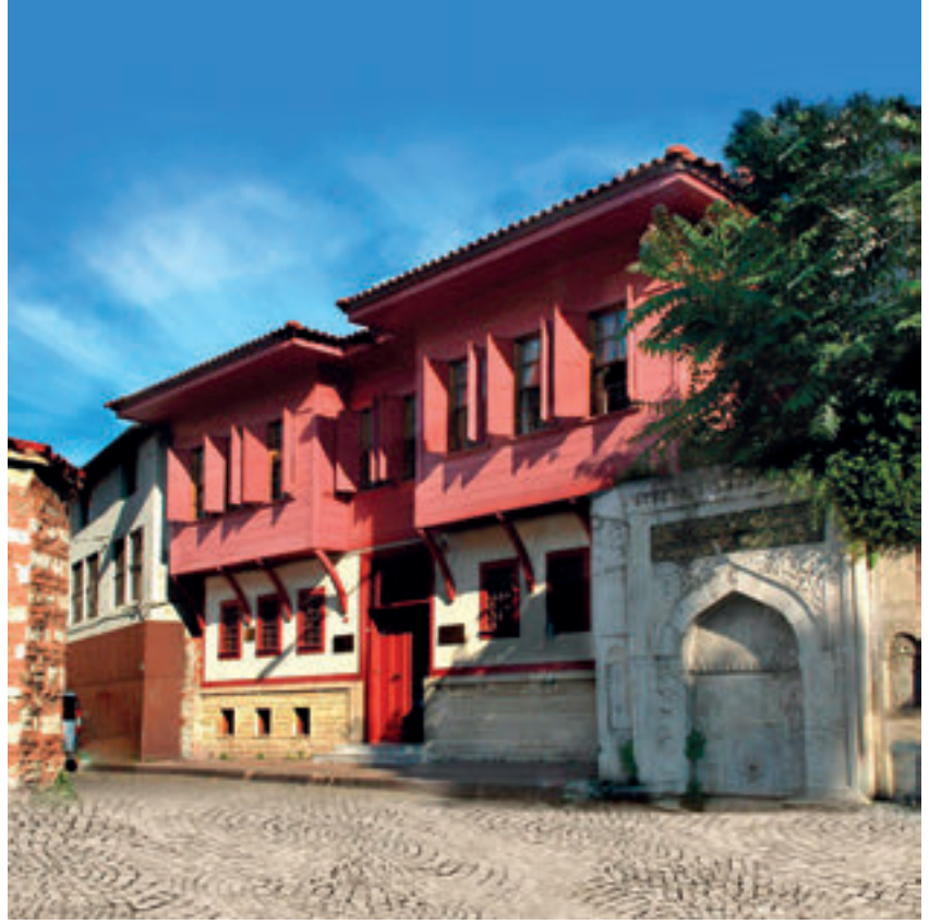
Dede Efendinin Cankurtaran'daki müze evi.

en büyük üstadı olacaksınız; Cenab-ı Hak bilgini çoğaltsın!" demişti.