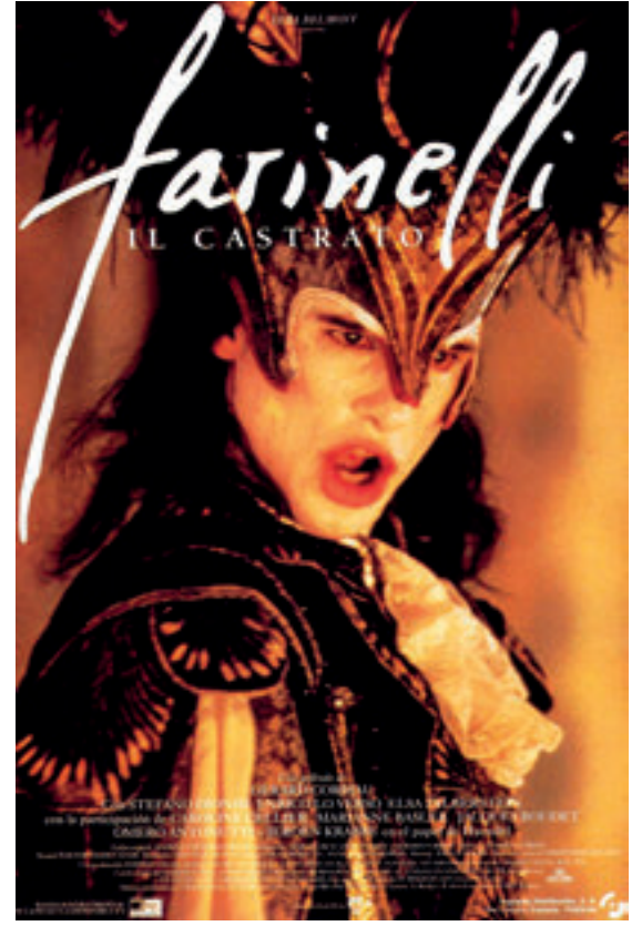
1994 yapımı "Farinelli: Il Castrato" filminin afişi.

re'ye) uzanan bir genişliğe sahiptir. Birkaç yıl sonra küçük notalarda daha düşük düzeyde genişlemiş ama herhangi bir yüksek notada kaybolmamıştır. Sadece onun seslendirmesi amacıyla bir opera aya yazılmıştır. Sesinin tonlaması saf, titremesi güzel, nefes kontrolü sıra dışı, boğazı çok çevik olduğundan ses en geniş aralıkta hızlı ve en kolay-kesin bir biçimde çıkmıştır. Ses süslemelerini her şekilde yapmak onun için kolay olduğundan üretken bir sesi vardır. Z