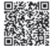
Beethoven, Symphony no. 9 "Choral"