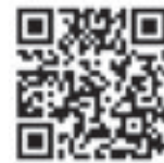
Haydn, Symphony no. 45 in F# min (Farewell) - I. Allegro Assai