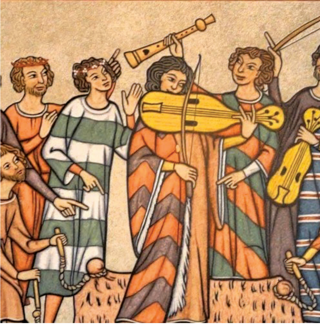
Ortaçağ müzisyenlerini tasvir eden bir fresk.

Kayrevan'a, ardından Endülüs hükümdarı I. Hakem'in daveti üzerine 822 yılında Kurtuba'ya gitti; vefat ettiği 852 yılına kadar Kurtuba'da hükümdarların himayesinde yaşadı. Ziryâb, İslam medeniyetinde müzik aletlerinin sultanı olarak tanımlanan uda beşinci teli ekleyen kişidir. İbn Haldun'un verdiği bilgiye göre on binden fazla şarkı bilen Ziryâb'ın Endülüs müziği üzerindeki etkisi uzun süre devam etmiştir.