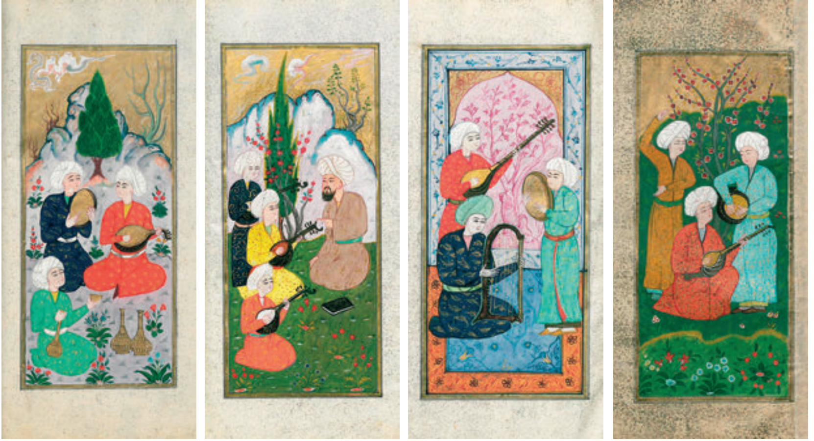
Berlin Devlet Kütüphanesi Ms.or. fol.3370 numara "Mecmua-i Müsiki" olarak kayıtlı minyatürlü güfte mecmuasından bazı minyatürler. Sırası ile 53b, 76b, 84a, 105a varaklar.

vayete göre Seyfüddevle, âlimlerle olan toplantısını dağıttıktan sonra Farabî ve saz heyetiyle başbaşa kalır. Seyfüddevle'nin arzusu üzerine saz heyeti çalmaya başlar, fakat Farabî çalınan müziği beğenmez ve mutrip heyetine yaptıkları hataları birer birer söyler. Yanındaki kendi icadı kanunu açarak akort verir ve neşeli bir parça çalar. Dinleyenler güler, eğlenir. Bu sefer kanunun akordunu değiştirip hüzünlü bir parça çalınca az önce gülenler ağlamaya başlar. En sonunda verdiği akort ile de nöbetçiler dâhil herkesi uyutur ve usulca meclisten ayrılır.