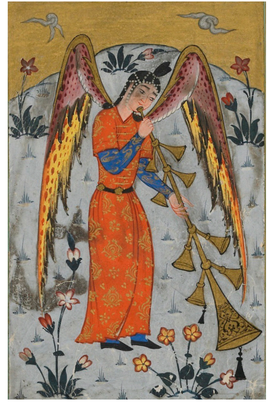
Sur’un 7 katlı trompet olarak tasvir edildiği Osmanlı minyatürü. 17. yüzyıl. The Keir Collection of Islamic Art.