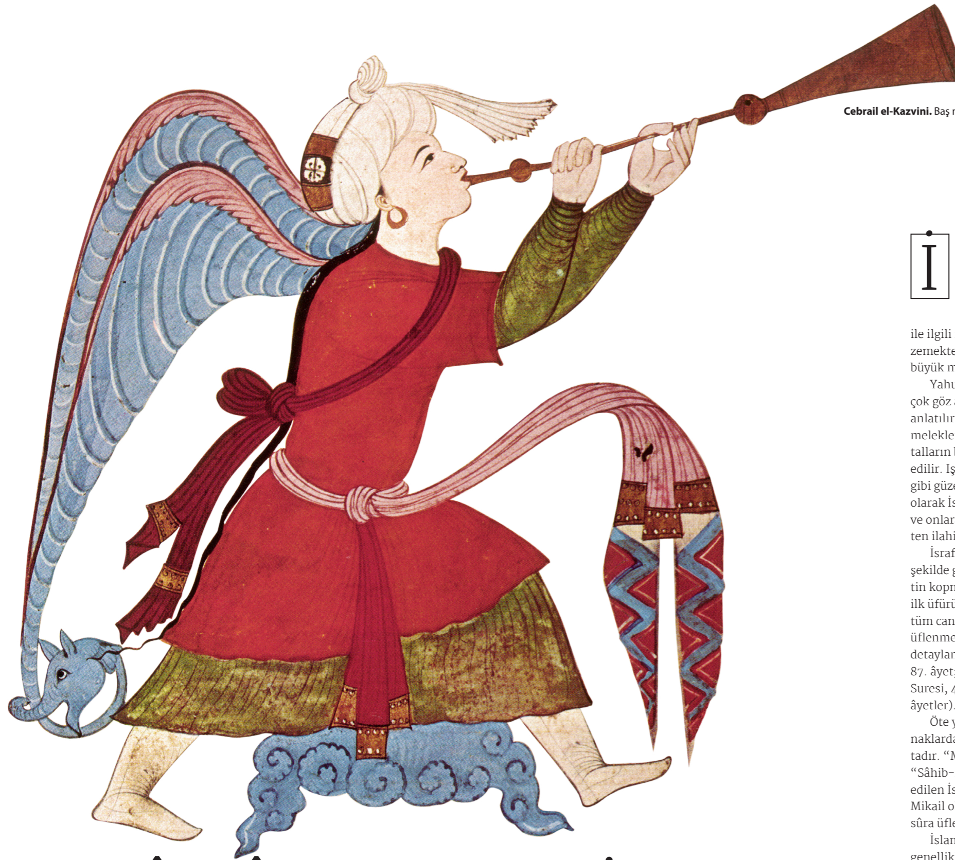
Cebrail el-Kazvini. Baş melek İsrâfil. 14. yüzyıl. The British Museum.